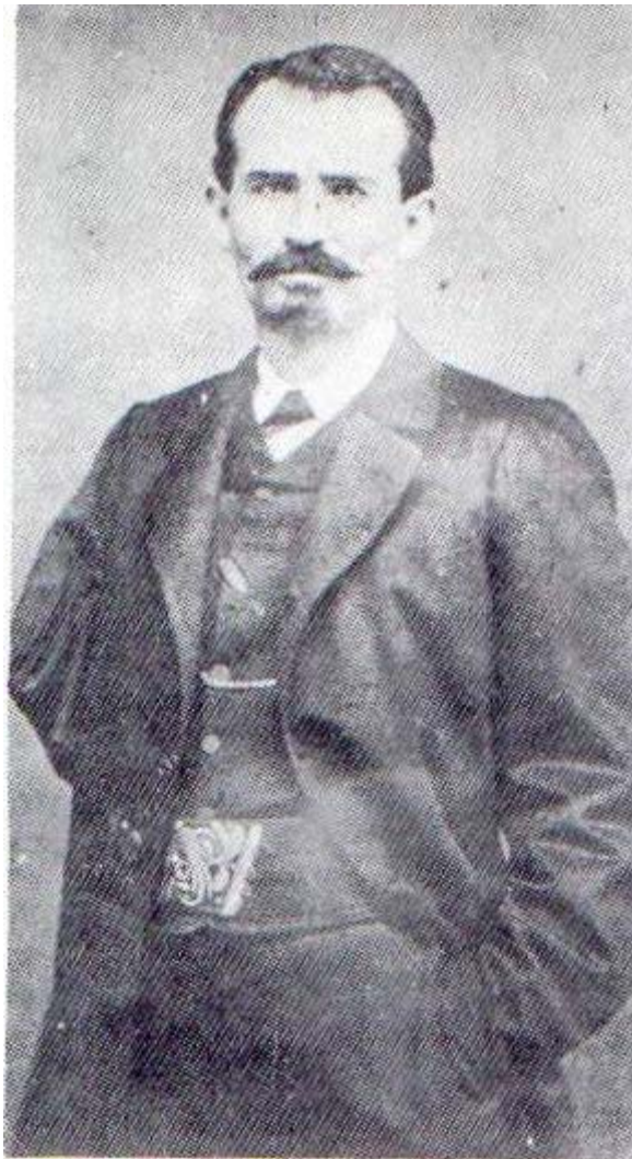
Coronel Manuel González

Algo más de lo que el general González disfrutaba era el andar a la moda y adecuadamente vestido para cada ocasión y actividad, de lo cual es una muestra la siguiente fotografía.