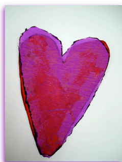
Rayo Mc. Queen quiere ir a Sinsentido

Dibujos de los niños en el curso de verano en 2011 en el Instituto Cultural Helénico. Los corazones representan la emoción que tenían por ir a Sinsentido .