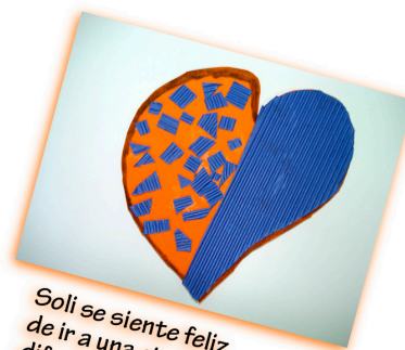
Soli se siente feliz de ir a una ciudad diferente.