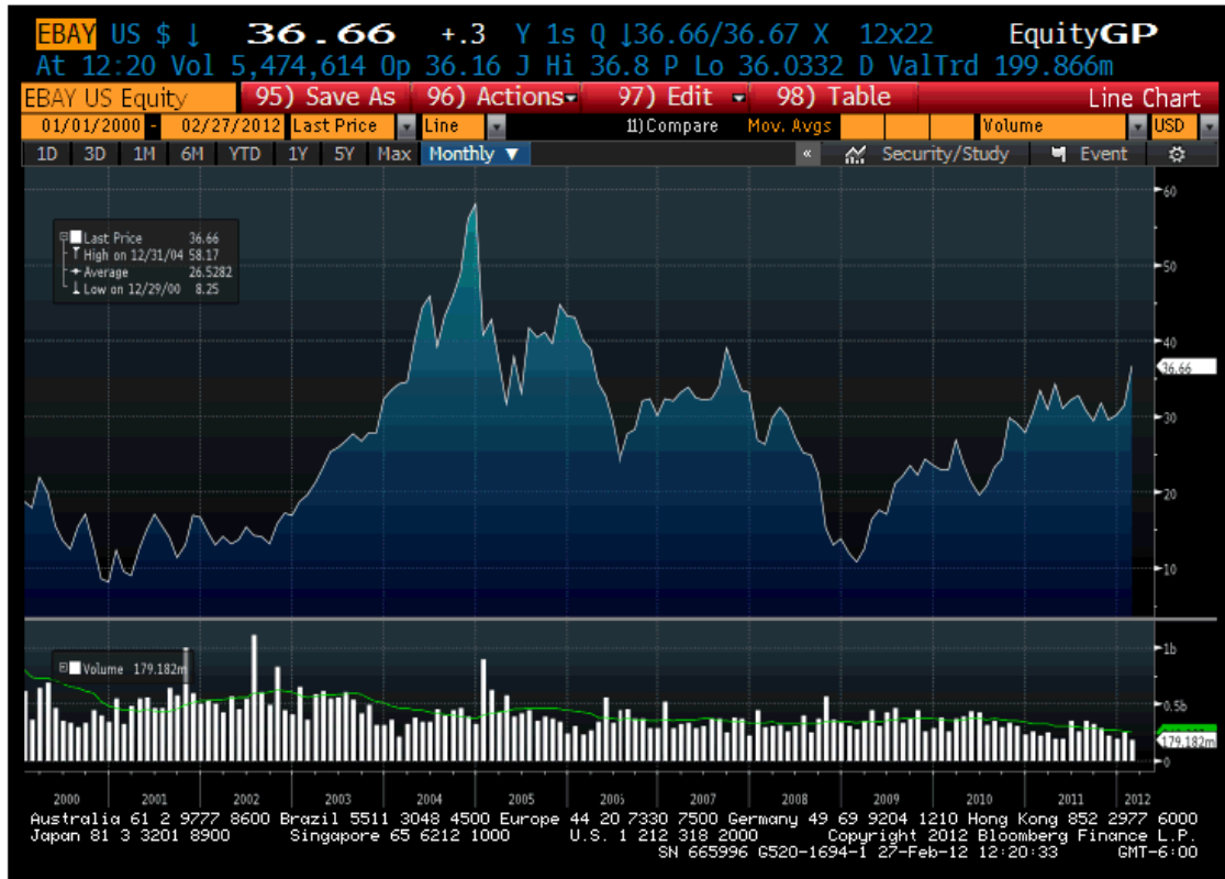
Anexo 2: Desempeño del precio de las acciones de eBay