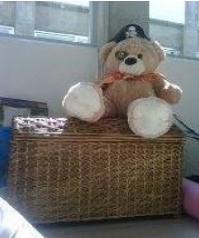
Pirata Max y el cofre del tesoro