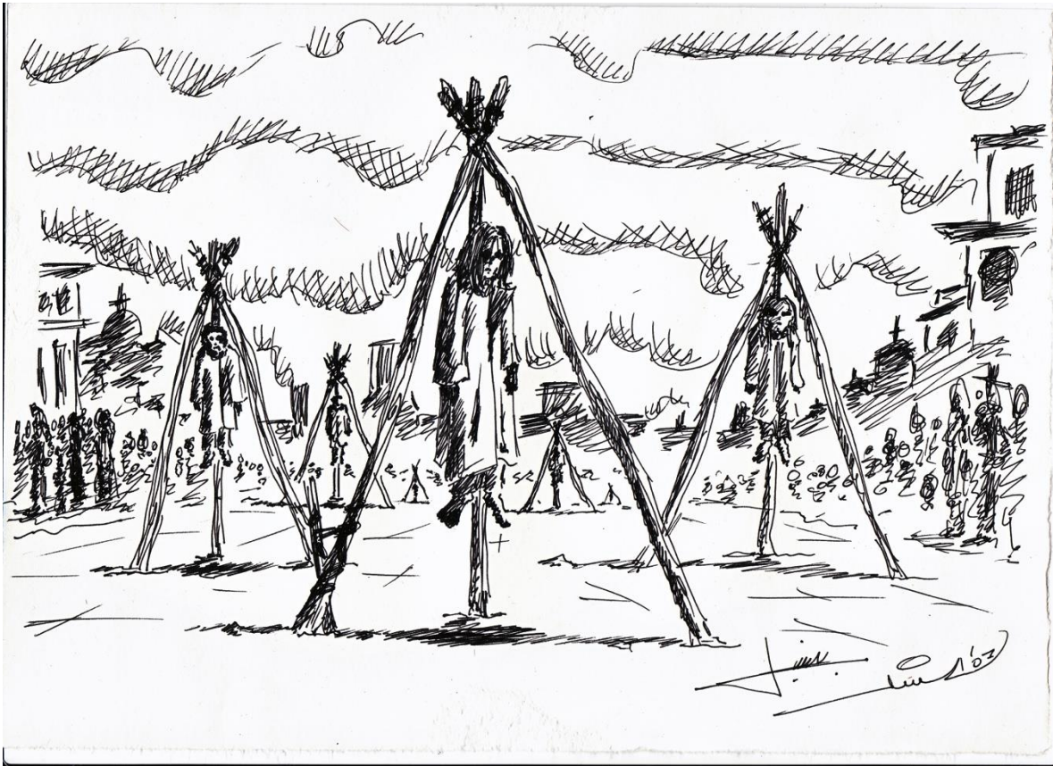
1 Descripción gráfica en la que el gobierno turco eliminaba a los intelectuales armenios.