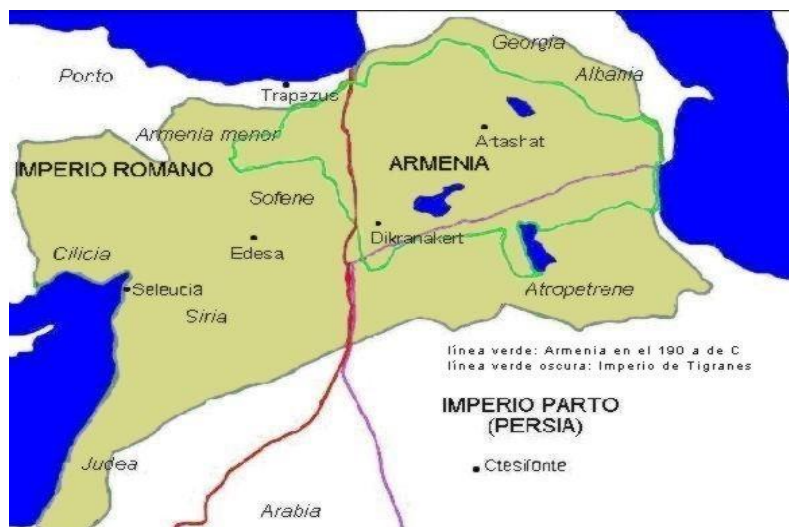
Máxima expansión del territorio armenio (95-66 a.C.) 8

No es posible fijar límites políticos precisos, ya que estos han sido modificados constantemente en el curso de las guerras que el país ha sufrido a lo largo de su historia.