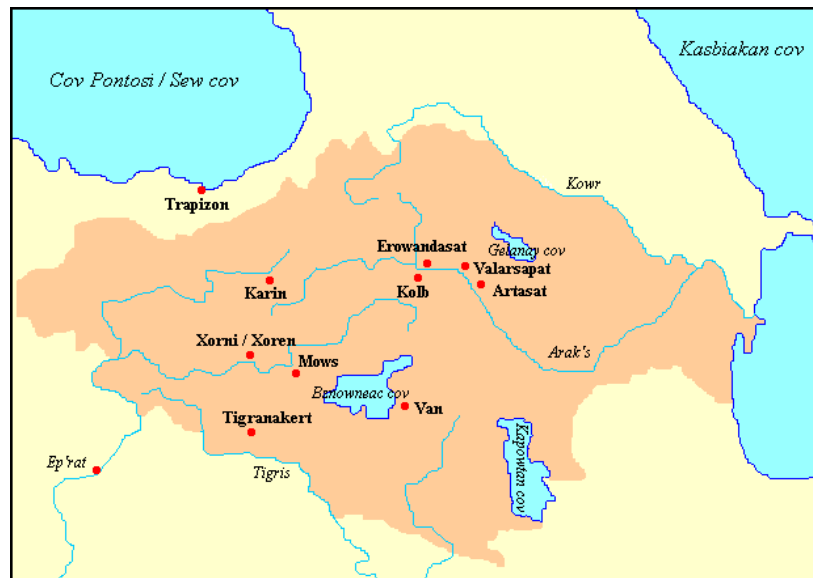
Mapa lingüístico del idioma armenio en su plenitud máxima. 9

Según Jorge Sarafian (1995) en idioma armenio, los armenios llaman „HAI“ y el país „HIASTAN“.