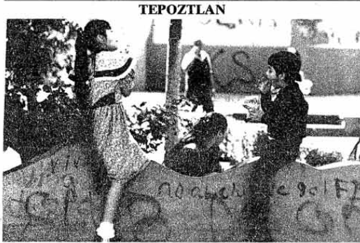
Inicio de semana □ Foto: Pedro Vallierra

Montemayor comentó que la agresión y violencia contra los derechos humanos "no son una fuerza ciega e incontrolable, sino una fuerza que actúa de manera selectiva, cuidadosa y metódicamente", y