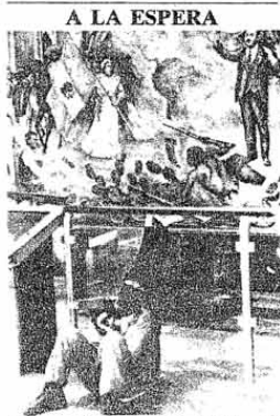
En la estación Universidad del Metro □ Foto: Fida Hartz

Finalmente, reconoció la labor y esfuerzo que realizan elemento del Ejército y Fuerza Aérea en beneficio de la sociedad para garantizar la seguridad en la zona, pero intervedrá si hay abusos.