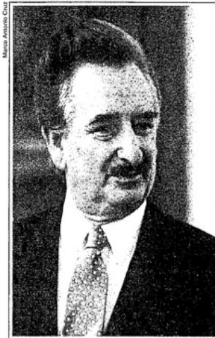
Gutiérrez Barrios. "Quien más sabe de estas cosas"

"Por otro lado, cada vez es más notoria la penetración del narcotráfico en las altas esferas gubernamentales. Se está fraguando una alianza entre los caballeros de la droga, los grandes empresarios y los políticos duros. Esta alianza sí que representa un peligro para la seguridad nacional."