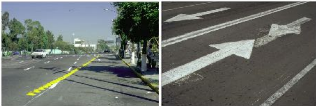
Figura 1.1 Conozca México III (topes-flechas) , 1996-2000, dos impresiones a color, 40.6 x 50.8, cortesía Galería Kurimanzutto, México

había cumplido con la obligación de renovar, reconvertir o directamente crear un nuevo equilibrio entre lo general y lo particular, como una manera de incitar a la reflexión de nuestro presente inmediato.