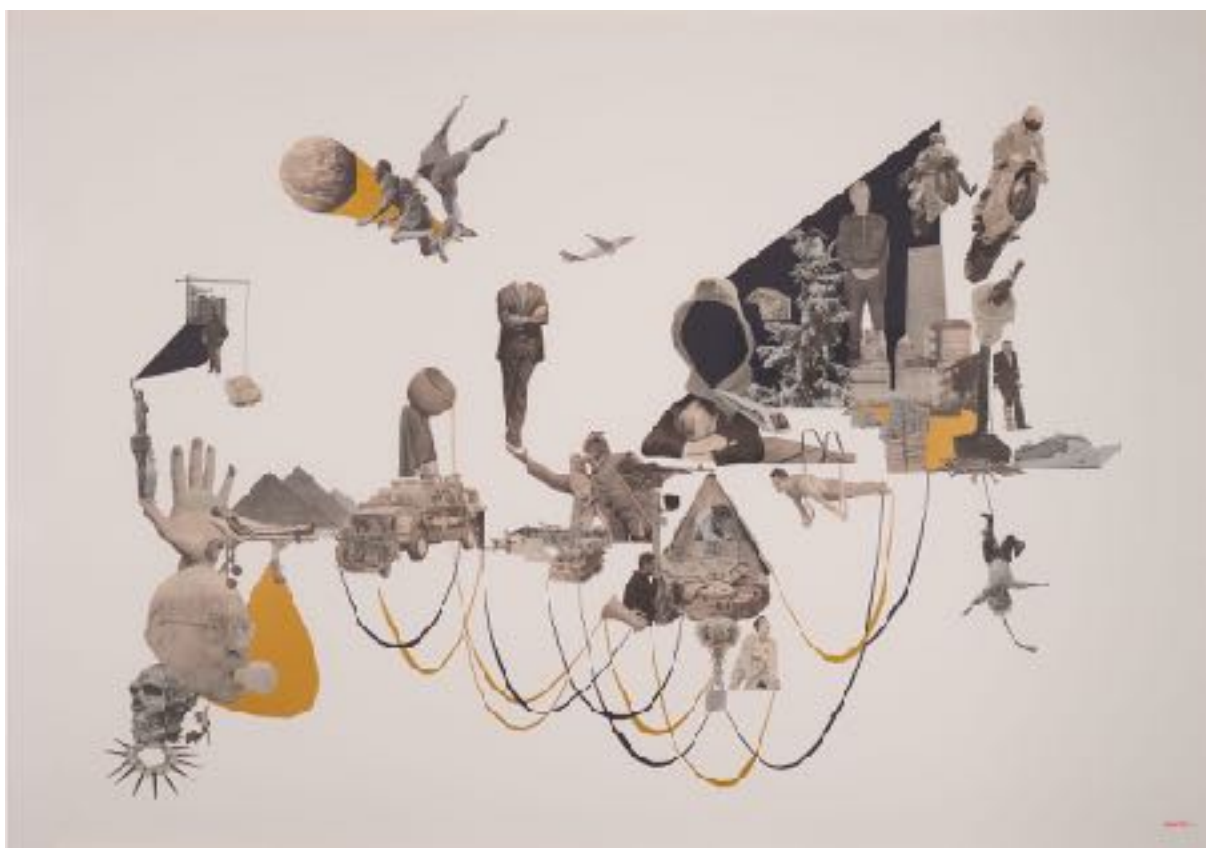
2.3 Rongwrong XXIV , 2013, periódico sobre cartulina, 154.9 x 222.3 cm. Collection Pérez Art Museum Miami, Miami