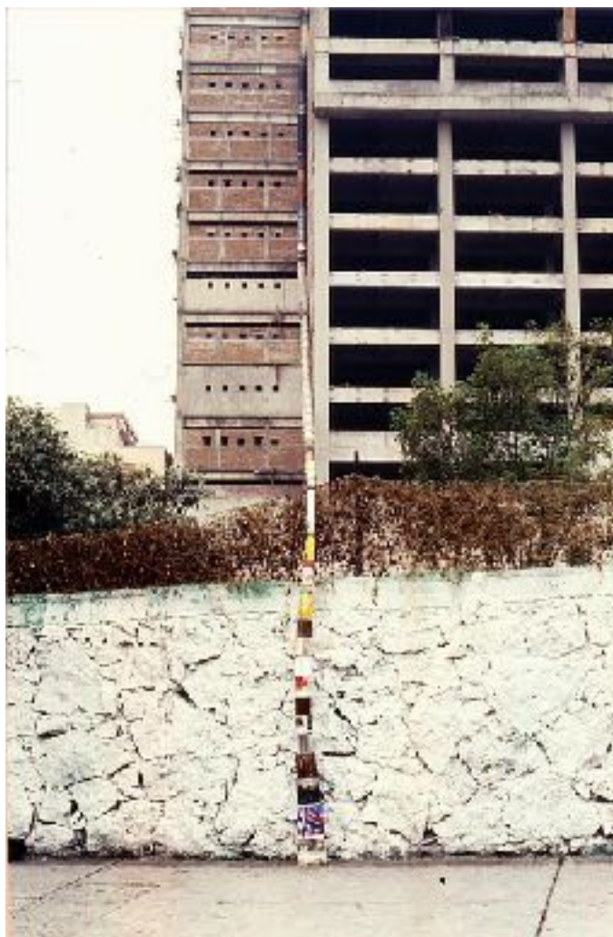
Figura 1.7 Tráfago , 1995-2004, impresión digital, 25.4 x 20.3 cm. Cortesía Galería Kurimanzutto, México

ávidas de nuevas identidades y nuevas diferencias, porque es un hecho que la gente quiere vivir en seguida, aquí y ahora, lo cual origina una nueva concepción de cultura que abandona los grandes sistemas de sentido que diluye los límites de lo local, lo regional y lo global (Guilles Lipovetsky, “L’ere du vie. Essais sur l’individualisme contemporain”, 1983), creando una fantasía de su propia realidad degenerada; tan pervertida que no hace más que volver mucho más interesante la reglas del juego de la vida.