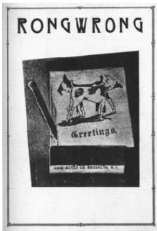
Figura 2.1 RONGWRONG , 1917, 28 x 20.3 cm, portada de revista del único número publicado en New York por Marcel Duchamp y editado en conjunto con Henri Pierre Roché y Beatrice Wood. IMAGE CREDITS n° 1 (July 1917) [toutfait]

Rongwrong de Jonathan Hernández no tienen la intención de resguardar imágenes como un contenedor visual de hechos pasados, ni tampoco la intención de conservar memorias de grandes sucesos de la Historia social contemporánea, sino, que a través del fotomontaje —el cual a diferencia del collage, se distingue por ser una técnica en el que la se manipulan imágenes que en su combinación dan origen a un nuevo elemento—, el artista diluye el discurso de la memoria condicionada por la Historia, pues una vez descontextualizadas las imágenes de cada pieza de la serie, éstas crean nuevos elementos que dialogan en un discurso que otorgan una lectura a múltiples posibilidades en su entendimiento. En efecto, Rongwrong es apenas una muestra de las