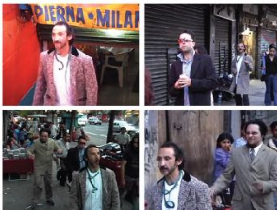
Figura 1.4 New York Groove , 2004, video transferido a DVD, 3 minutos

coreográfico de tres minutos de duración en el que el artista recorre una de las vialidades más emblemáticas de la Ciudad de México —el eje central—, evidenciando que la creación de nuevas centralidades polivalentes en sus funciones y mixtas en su composición social, son elementos consustanciales de la democracia urbana. En efecto, hoy podemos decir que el arte de que se estructura desde los años noventa se trataba en esencia de un arte que capturó la cultura popular y cotidiana bajo la forma de imágenes de un carácter más referencial y conceptual.