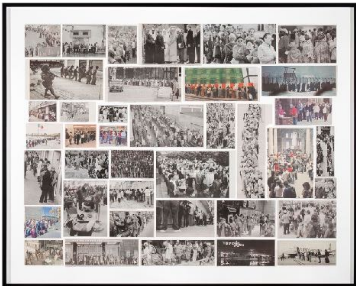
Figura 3.3 Vulnerabilia (filas), 2008-2010, collage sobre cartulina, 87.5 x 130.3 x 4 cm.