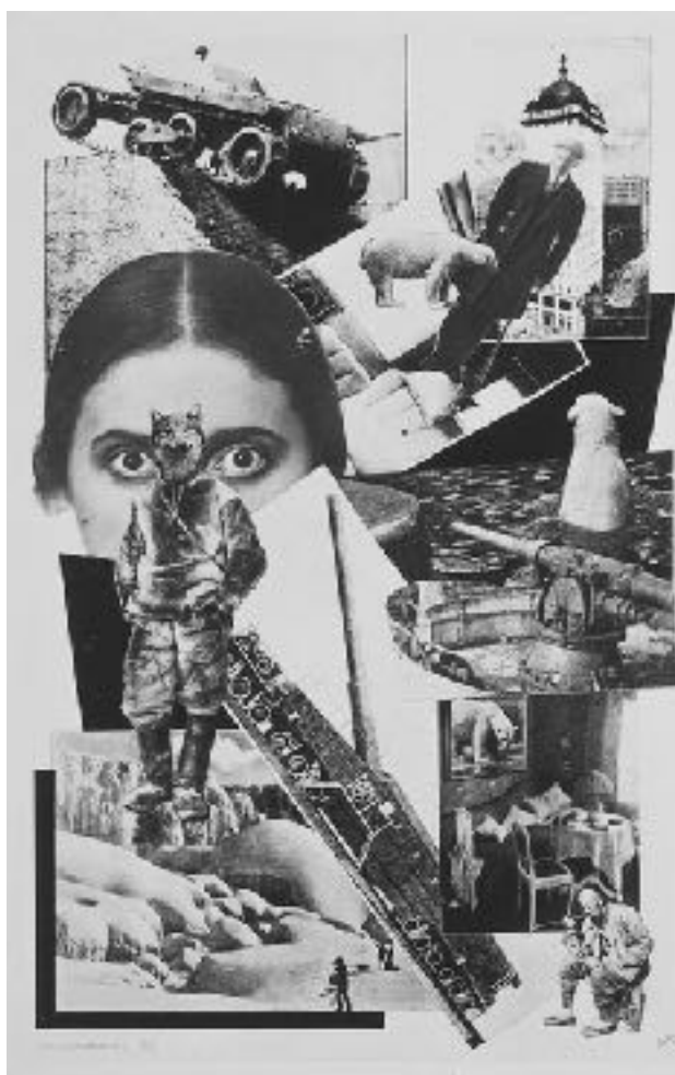
Figura 3.2 Alexander Rodchenko, Photomontage for Majakovski's "Pro Eto" , 1923, periódico sobre papel, 21.5 x 16 cm, Ludwig Collection