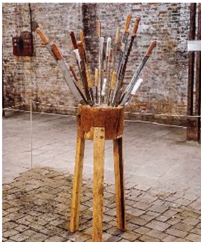
Figura 1.5 Aeropuerto Alterno , 2002, cuchillos y madera, dimensiones variables, cortesía Galería Kurimanzutto, México

evolución, donde a la par de las protestas sociales, desarrolla una crítica radical y definitiva de la concepción tradicional del arte separado de los procesos sociales. No obstante, el fenómeno para comprender las nuevas reglas del juego implica entender a su vez, que un mercado expandido ha reabsorbido esa historia revolucionaria mediante una lógica comercial que, como antaño, cosifica y mercantiliza iniciativas —en principio dirigidas a diluir las fronteras entre el arte y sociedad—. Con todo, la contemporaneidad del arte representa una posibilidad, precaria pero decisiva, de reconectar la práctica del arte con las agendas sociales más urgentes. Esta posibilidad ha sido y continúa, siendo teorizada por diversos actores, no solamente artistas y curadores, sino, crucialmente, el público del arte contemporáneo.