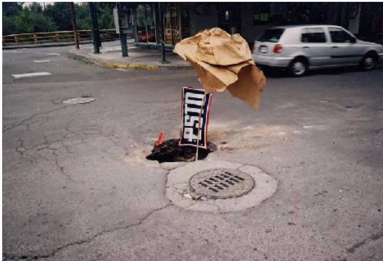
Figura 1.3 Conozca México VII (esto) , 1996-2000, dos impresiones color, 50.8 x 61, cortesía Galeria Kurimanzutto, México