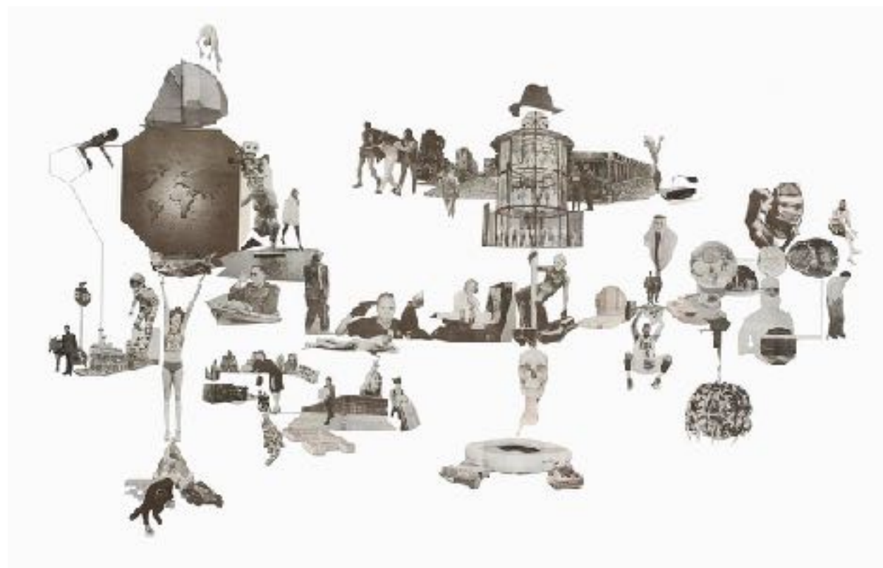
2.2 Rongwrong XIII, 2007, periódico sobre cartulina, 132 x 208 cm.

trata únicamente de la alineación constitutiva del sujeto en el orden simbólico, es decir, como sostiene Slavog Žižek “ese Gran Otro es el nombre para la sustancia social, para todo lo que explica por qué el sujeto nunca domina plenamente los efectos de sus actos” (Slavog Žižek, La suspensión política de la ética , 2005, p. 154). Tal parece que Rongwrong XIII no sólo es la representación visual de un mundo meditativo absorbido por el espejo y la vanidad, sino que se convierte en el reflejo más puro de las cualidades más contemporáneas de una sociedad que ha distorsionado el estilo de vida a múltiples maneras de placer devenidas principalmente por el consumo, el dinero y la violencia.