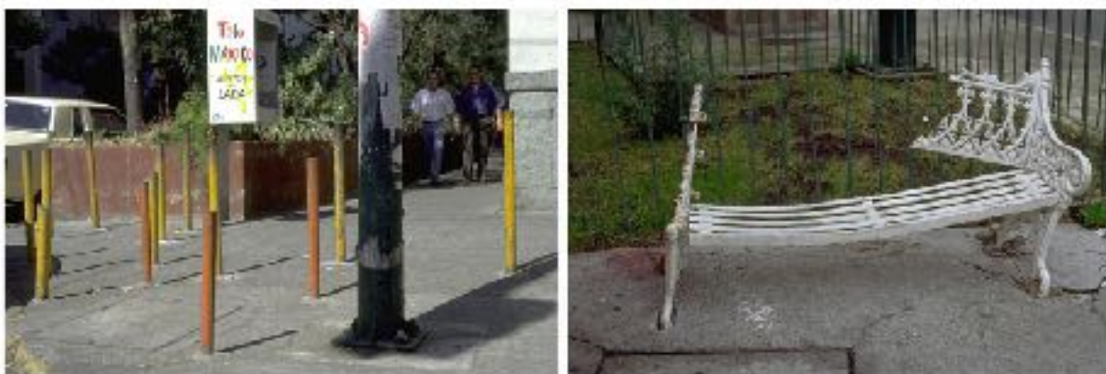
Figura 1.2 Conozca México I (postes-banca) , 1996-2000, dos impresiones a color, 40.6 x 50.8, cortesía Galería Kurimanzutto, México