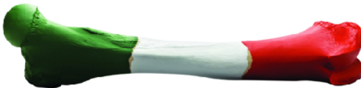
Figura 1.6 Fémur de Elefante Mexicano , 2010, hueso y pintura, 38.58 x 10.83 x 7.48 pulgadas. Cortesía RM + Musée d'art Moderne de la Ville de Paris + Museo Amparo

década y media de la transición de un siglo a otro no resulta sencillo explicar el desarrollo del arte posterior al siglo XX, sobre todo cuando el incremento de productores y de propuestas es excesivo, cuando las social networks se vuelven una extensión inmaterial de nuestra existencia diaria, y, resurge una confusión de discursos en lo político, lo económico, lo moral y lo estético. Sin embargo, tal parece que nos encontramos en la cúspide de nuevas posibilidades de lo estético, siendo el arte mexicano actual un fenómeno que se fecunda a través de las paradojas de lo actual y lo inmediato y la cultura basado en lo fútil.