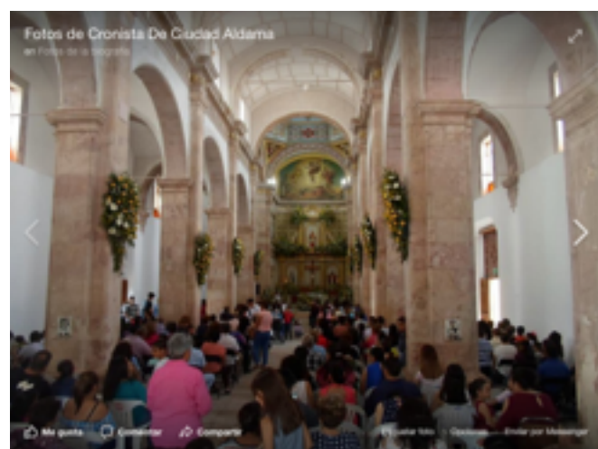
Interior y exterior del Templo de San Jerónimo, en Ciudad Aldama, Chih 432 .