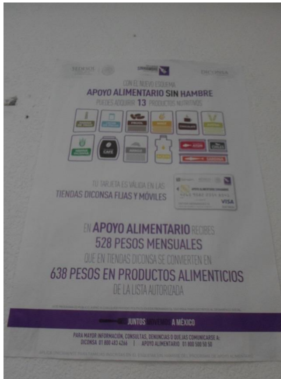
Foto 19. Cartel publicitario “apoyo alimentario sin hambre”. 2014.

Desarrollo Social- y puede llevar trece tipos de alimentos: arroz, sardina, atún, chocolate en polvo, frijol, harina de trigo, harina de maíz, café soluble, avena, chiles enlatados, maíz, leche en polvo, aceite y se agrega huevo fresco. En cambio, no podrá llevar champú, jabón de baño, porque es estrictamente alimentario. Y quien esté ya en el programa Oportunidades no puedes recibir el apoyo de País sin Hambre, pues son nuevas incorporaciones (Entrevista a jefe del programa Oportunidades, mayo de 2014).