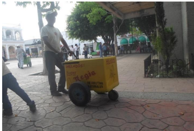
Foto 7. Señor vendiendo helados en el parque central. 2015.

Se ubican también en el parque, puestos de lustrabotas con publicidad política, atendidos por jóvenes de aproximadamente 14 años en adelante.