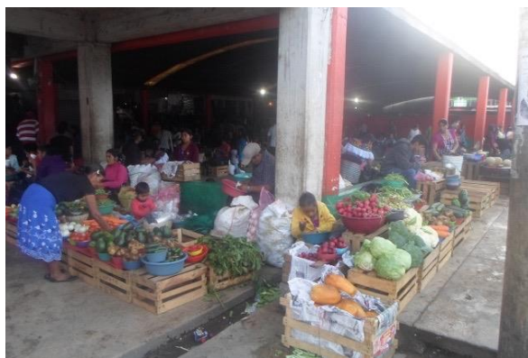
Foto 16. Esquina del Tianguis campesino indígena. 2015.

A las orillas del tianguis campesino hay otros puestos de verduras en los que venden mujeres que no llevan puesto traje tradicional, también hay hombres, jóvenes y niños vendiendo productos diferentes o similares a los que están dentro del espacio con techo.