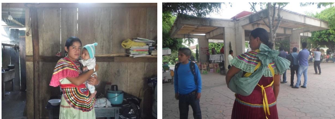
Foto 17 y 18. Mujeres tzeltales de la zona selvática con su traje tradicional. 2015.

Por su parte, las tzeltales selváticas o de tierra bajas, usan un traje muy colorido, es además un traje que implica mucho trabajo al tenerse que tejer cada uno de los listones de la blusa y del mandil.