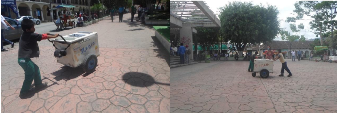
Foto 5 y 6. Niños vendiendo helados en el parque central. 2015.