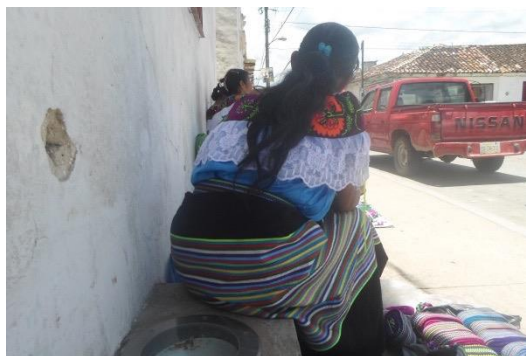
Foto 16. Mujer tzeltal exponiendo para la venta sus productos artesanales fuera de la iglesia. 2015.

La vestimenta de las mujeres es otro componente importante dentro de los espacios de comercialización en la ciudad de Ocosingo, lo que hace que sea fácil identificar de qué tipo de comunidad o zona provienen y qué tipo de productos son los que ofrecen. Por ejemplo, las mujeres de Sibaca usan la blusa blanca con flores, a diferencia de otras mujeres cuyas blusas tienen un fondo verde o azul. Muchas de las mujeres llevan su cabello trenzado, con llamativos listones. Ellas explican que los siete colores de los listones que llevan las enaguas azul oscuro, son los del arcoíris.