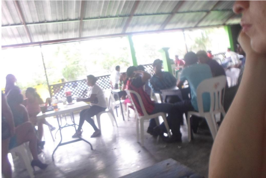
Foto 24. Restaurant en Ocosingo. 2015.

Las muchachas me miraban con inquietud. Cuando se terminó mi cerveza aún no quería salir del lugar pues quería observar un poco más, así que llamé a una de las chicas para que me trajera otra cerveza.