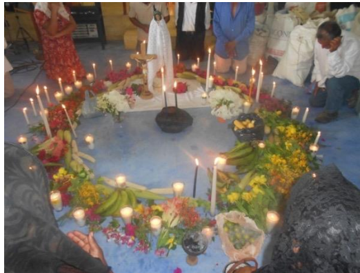
Foto 24. Celebración de la milpa en comunidad Frontera Corozal. 2015.

La siguiente, es una imagen de la celebración del “día de la milpa”, del “sagrado maíz” en una comunidad chol en la que tuve la oportunidad de estar.