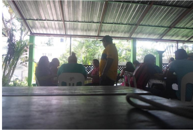
Foto 26. Restaurant en Ocosingo. 2015.