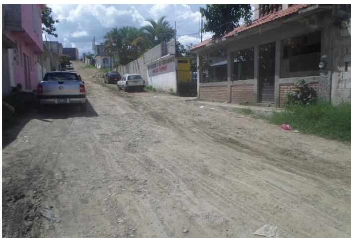
Foto 23. Restaurant en Ocosingo. 2015.

Hubo una situación que forzó a que dos de los hombres que consideré inicialmente mis principales informantes me hablaran con sinceridad sobre la situación que viven las mujeres migrantes centroamericanas en Ocosingo. Fue un día que llegué a realizar una entrevista a una mujer centroamericana cuya casa estaba a dos cuadras del Restaurante Bar los Tulipanes. La ansiedad etnográfica por ver desde dentro y por experiencia propia la dinámica de los establecimientos, hizo que en ese momento decidiera entrar al bar sin pensar mucho en los riesgos que corría.