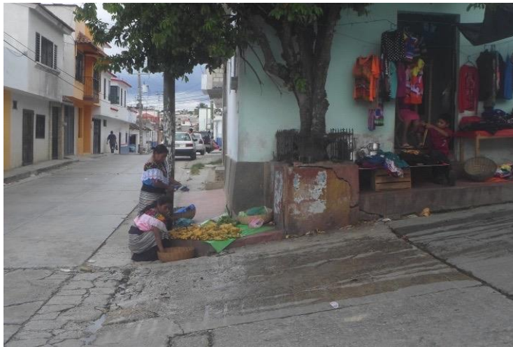
Foto 1. Mujeres de Sibaca vendiendo en la calle de la ciudad. 2015.

Un día a las siete de la mañana, salí a comprar mis alimentos. En el camino encontré mujeres que vendían diferentes productos en las calles de la ciudad como atole y tamales. Otras, con su traje tradicional tzeltal, vendían plátanos sentadas en el piso junto a la terminal de buses. Me comentan que son de Sibaca, una de las comunidades más cercanas a la ciudad, cuyas tierras son consideradas las más fértiles de Ocosingo y que tiene como principal producto comercial, el plátano. Más abajo, dos cuadras antes de llegar al parque, estaban sentadas en una banqueta otras mujeres con plátanos, también de Sibaca. Ellas conversaban y tejían mientras esperan a los compradores.