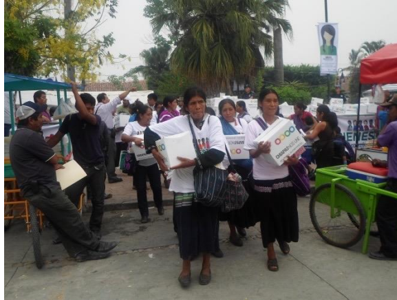
Foto 20. despensa entregada a mujeres indígenas en acto público con presencia del gobernador Manuel Velásco Coello. 2015.

de la comunidad se llena de comercios, de personas y de basura. Nuestros patios, caminos y parcelas se convierten en basureros de los industriales: envases de plástico, envolturas, bolsas, latas, unicel, vidrio, pañales, envases de refresco y de agroquímicos etc. (Entrevista realizada a líder de Frontera Corozal, 13 de septiembre de 2015).