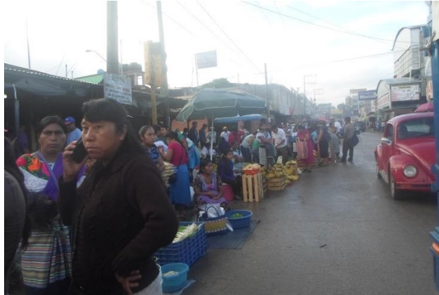
Foto 10. Costado exterior del Tianguis campesino indígena. 2015.