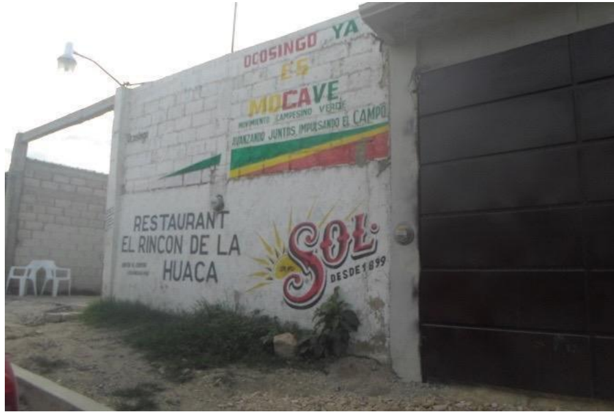
Foto 22. Restaurante bar en Ocosingo. 2015.