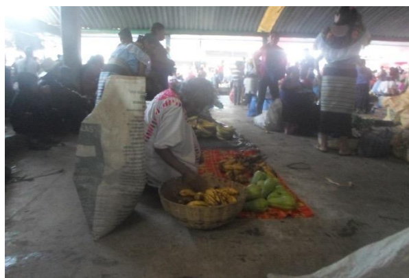
Foto 13. Anciana con sus productos en plaza del tianguis campesino indígena. 2015.

En frente de nosotros se ubica otra anciana que sobre una manta pone chayote y guineo, diagonal a ella se pone una familia que desempaca palmito y chapai. Mientras la madre vende, la niña de unos 9 años lleva a su hermanito a cuesta, pues desde esa edad, según Martín, “ya tienen al hermanito a su cargo”.