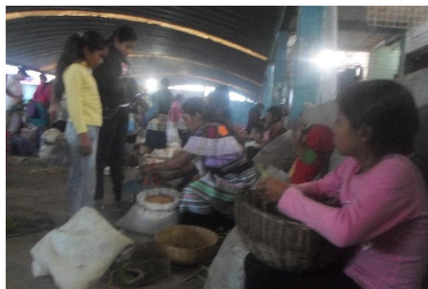
Foto 11 y 12. Anciana y niña desgranando fríjol en la plaza del tianguis campesino indígena. 2015.

En frente de nosotros se ubica otra anciana que sobre una manta pone chayote y guineo, diagonal a ella se pone una familia que desempaca palmito y chapai. Mientras la madre vende, la niña de unos 9 años lleva a su hermanito a cuesta, pues desde esa edad, según Martín, “ya tienen al hermanito a su cargo”.