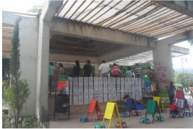
Foto 9. Negocio de pintura con caballetes para niños, parque central de Ocosingo. 2015.

En las calles que circundan al parque, se encuentran diferentes locales: de ropa, zapaterías, internet, fotocopiadoras, verduras, frutas, jugos, tienda de abarrotes, celulares, carnicerías, peleterías, papelería, venta de llamadas, restaurantes, entre otros negocios cuyos dueños son gente ladina.