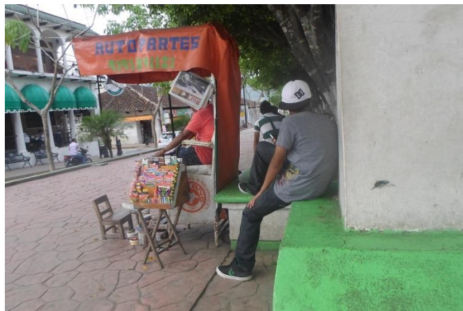
Foto 8. Lustrabotas en el parque central. Todas las fotos son de 2015.

Se ubican también en el parque, puestos de lustrabotas con publicidad política, atendidos por jóvenes de aproximadamente 14 años en adelante.