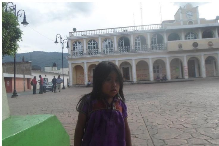
Foto 2. Niña tzotzil en el parque central de Ocosingo. 2015.

Fuera de la iglesia varias mujeres vestidas con su traje tzeltal ponen en el piso sus puestos de artesanías –blusas, cinturones- ellas se sientan en los bordes de cemento que sirven como asientos, mientras tejen y conversan.