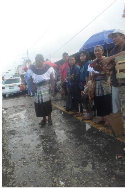
Foto 15. Mujer indígena vendiendo gallina en un costado del Tianguis campesino indígena. 2015.

La vestimenta de las mujeres es otro componente importante dentro de los espacios de comercialización en la ciudad de Ocosingo, lo que hace que sea fácil identificar de qué tipo de comunidad o zona provienen y qué tipo de productos son los que ofrecen. Por ejemplo, las mujeres de Sibaca usan la blusa blanca con flores, a diferencia de otras mujeres cuyas blusas tienen un fondo verde o azul. Muchas de las mujeres llevan su cabello trenzado, con llamativos listones. Ellas explican que los siete colores de los listones que llevan las enaguas azul oscuro, son los del arcoíris.