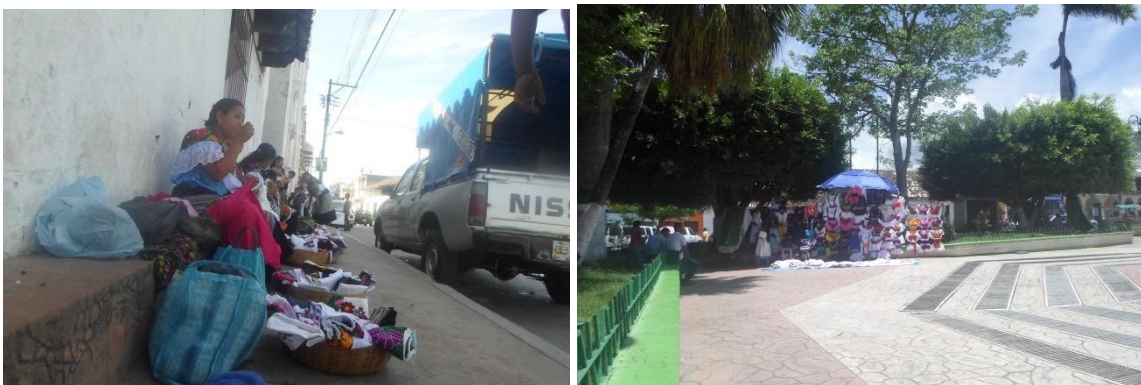
Foto 3 y 4. Mujeres exponiendo a la venta sus productos artesanales. 2015.

Fuera de la iglesia varias mujeres vestidas con su traje tzeltal ponen en el piso sus puestos de artesanías –blusas, cinturones- ellas se sientan en los bordes de cemento que sirven como asientos, mientras tejen y conversan.