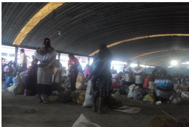
Foto 14. Plaza, Tianguis campesino indígena. 2015.

A las orillas del tianguis campesino hay otros puestos de verduras en los que venden mujeres que no llevan puesto traje tradicional, también hay hombres, jóvenes y niños vendiendo productos diferentes o similares a los que están dentro del espacio con techo.