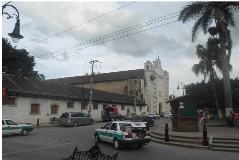
Foto 21. Visita de un costado del Parque y de la Iglesia San Isidro de Polonia. 2015.