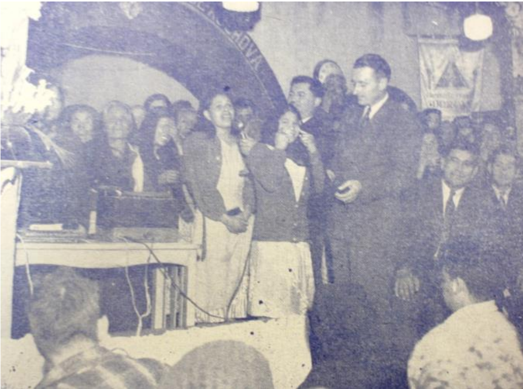
Campana de sanación realizada en Torreón, Coahuila.