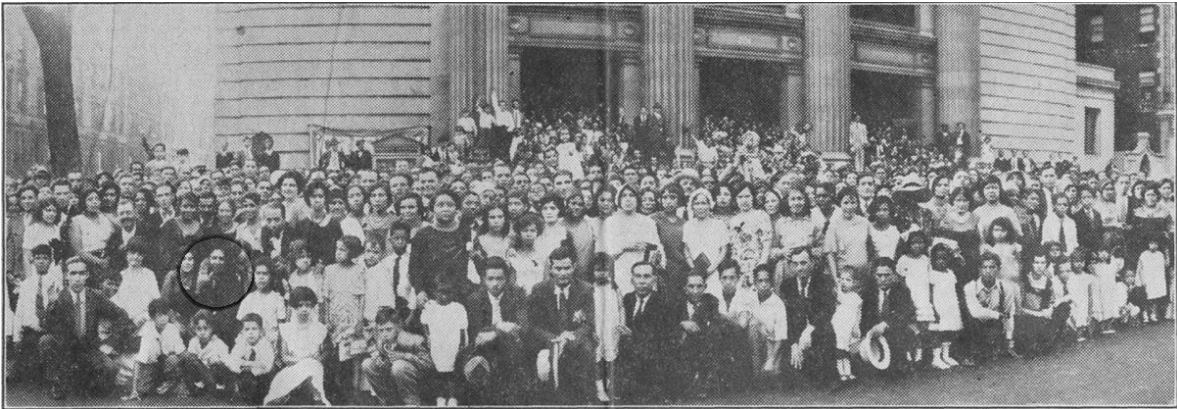
Predicador Francisco Olazábal (marcado en el círculo) luego de un culto de sanidad en el templo Jamaica Tabernacle, New York.