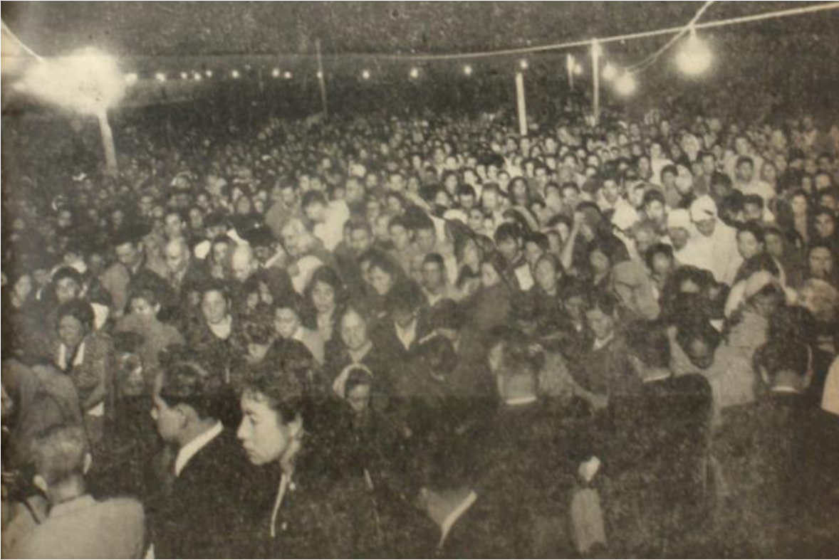
Campana de sanación en la Ciudad de México, tomada el 7 de abril de 1956.