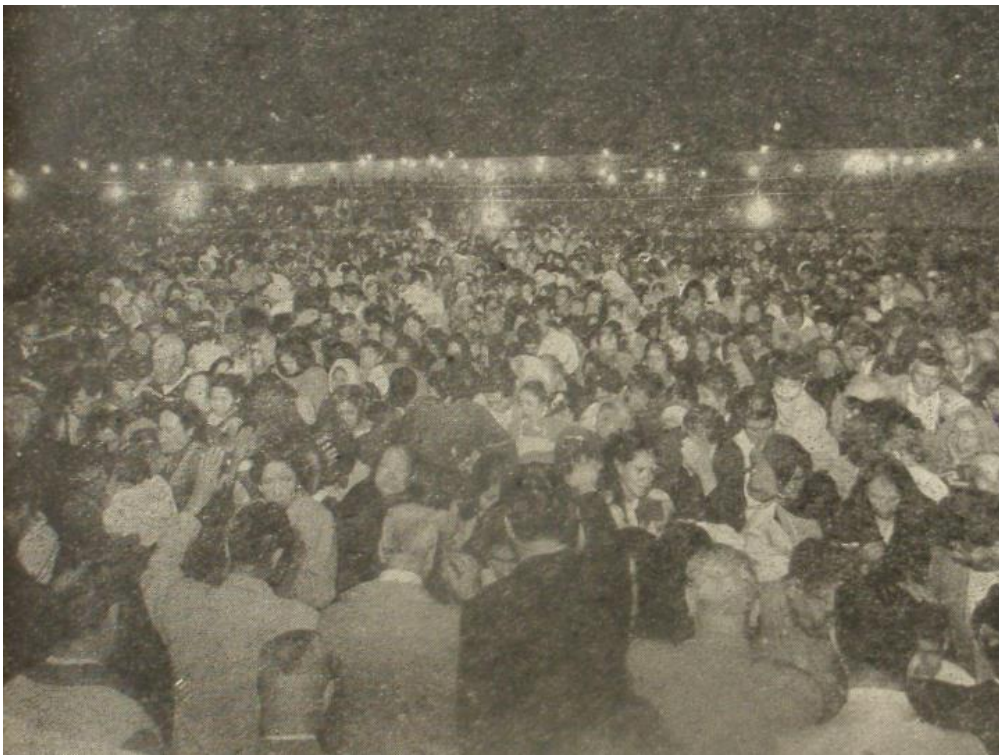
Campana de sanación en la Ciudad de México, tomada el 7 de abril de 1956.