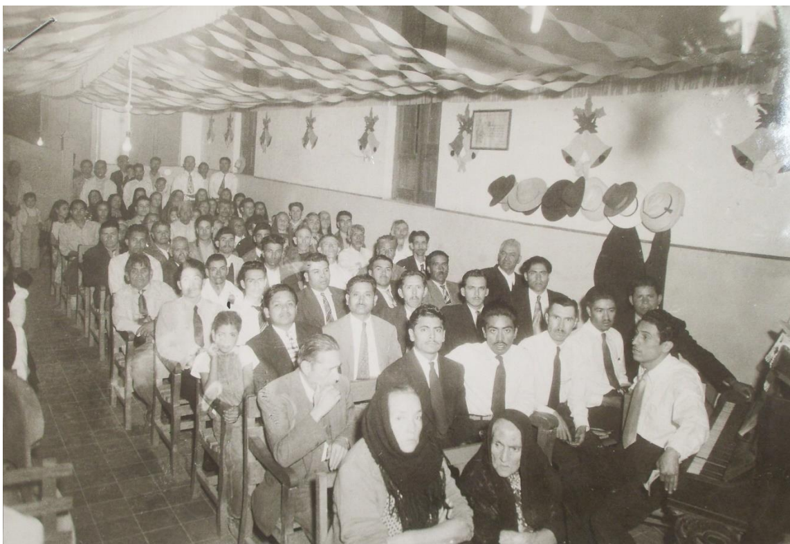
Reunión en templo de la Iglesia Apostólica de la Fe en Cristo Jesús, ubicado en la calle 32 del Sector Libertad, no. 47, Guadalajara, Jalisco.