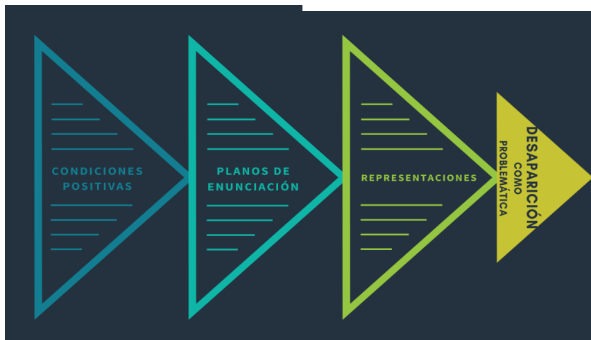
Fig. 1- Diagrama de la temática