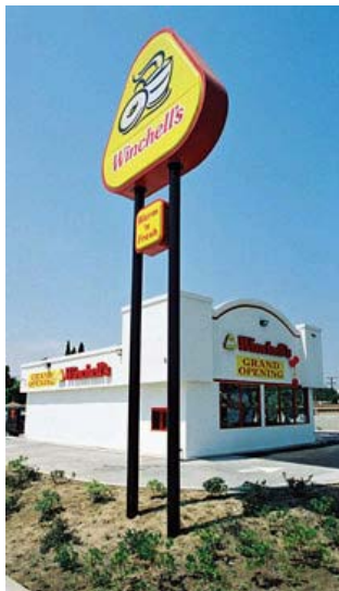
Imagen corporativa de las tiendas

En 2000 comenzó un programa de expansión en seis ciudades de Estados Unidos donde las ventas de la compañía eran fuertes: dicho programa consistía en reclutar franquicias de comida rápida para agregar quioscos de Winchell's a sus tiendas. La firma también ofrecía a los socios de manejo conjunto de marca la opción de agregar una Winchell's World Donut Factory completamente montada. Una de las ciudades elegidas para el esfuerzo del manejo conjunto de marcas de Winchell's era Omaha, Nebraska, donde recientemente se habían abierto dos locales de Krispy Kreme. El franquiciatario de KK de Omaha no estaba planeado tener tiendas adicionales en esta ciudad, pero estaba aumentando el número de sus clientes de tienda de conveniencia, suministrándoles entregas nocturnas a domicilio desde las dos ubicaciones existentes en la población. 7