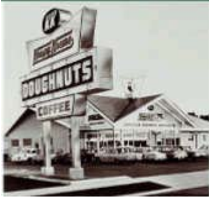
Imagen corporativa que mantenían todas las tiendas.

En 1973 Vernon Rudolph muere y el crecimiento de la compañía comienza a estancarse en así como se decide vender la marca a Beatrice Foods en 1976, dejando de ser la empresa familiar que controlaba proceso, fórmula e imagen. El nuevo dueño procedió a realizar una serie de cambios. Se cambió la receta y se modificaron los logotipos de grafía manuscrita para darle una apariencia más moderna. Los clientes reaccionaron negativamente al cambio el negocio declinó.