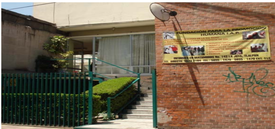
Entrada de la Fundación para la Promoción Humana I. A. P. (Casa de reposo Mateos Portil)

de 20 años de experiencia, que está a cargo de la vigilancia de la salud de los viejos y realiza labores administrativas; además, lleva a cabo unas jornadas de discusión de temas de gerontología en el mes de agosto. La trabajadora social informa a los familiares sobre los servicios, cuida el desempeño del adulto mayor, planea las actividades, consigue los maestros que imparte los talleres, “está pendiente de que coman” e identifica las necesidades. El psicólogo atiende de manera individual a los ancianos, “en la parte mental y emocional”, aplica pruebas, orienta, facilita las terapias y se coordina con la trabajadora social, para que ambos resuelvan los problemas incorporando, si se puede, a la familia. La terapeuta física imparte “los ejercicios de bajo impacto y de ocho tiempos, así como la estimulación del pensamiento y la memoria”. Además, se encuentran siete personas en el área de cocina, cinco recamareras, dos personas en mantenimiento, la administradora y los practicantes, quienes ayudan en todas las áreas.