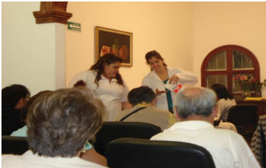
Conversación sobre terapia ocupacional en el grupo de apoyo