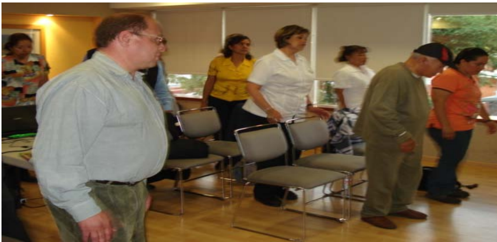
Técnicas del cuidado especializado impartidas en el grupo de apoyo

aliviar el sufrimiento que padece el familiar. Los pacientes pueden entrar a las sesiones, uno de ellos ha sugerido técnicas del cuidado y recomendado lecturas; creo que lo más importante es que ha representado a sus compañeros. A pesar de la postura del centro de día contra la violencia y la recuperación de la libertad de los familiares y la dignidad del anciano, todavía existen algunos puntos que tiene que mejorar para cumplir con su misión y su impacto social, como denunciar los casos de violencia doméstica que se presentan, pues debe terminar de proteger a los que su voz es a veces opacada y a las familias que viven en un atolladero y deben ser orientadas.