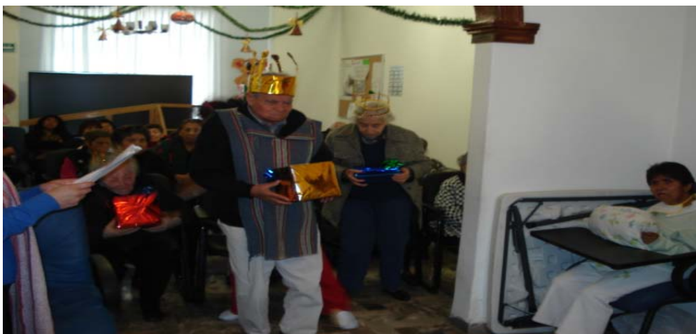
Participación en la pastorela