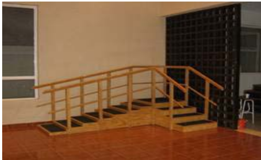
Zona de ejercicios en Alzheimer México I. A. P. (Polanco).

Poco a poco se fue ganando la confianza y el reconocimiento entre las familias, al demostrar que el fin último era el mejoramiento de la calidad de los pacientes y que no se cobraban cuotas de recuperación elevadas a quienes no tenían suficientes recursos económicos, a pesar de estar en una zona de prestigio social. También se fue ganando respeto por ser una “institución escuela”, que ha enseñado a grupos de enfermería del Instituto Nacional de Cardiología, la FES Zaragoza de la UNAM, la FES Iztacala de la UNAM, la Escuela de Enfermería del IMSS, la Escuela de Enfermería del ISSSTE, así como a estudiantes de la Facultad de Psicología de la UIA y de la UNAM, campus Ciudad Universitaria, y colegiales del CETIS número 5 en trabajo social y del CETIS en gericultura número 10. Cabe mencionar que los convenios firmados con estas escuelas se hicieron a través de la presidenta, la enfermera y la trabajadora social.