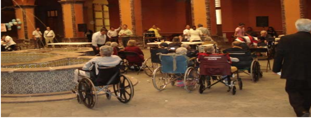
Fundación Concepción Béistegui para Ancianos I. A. P.