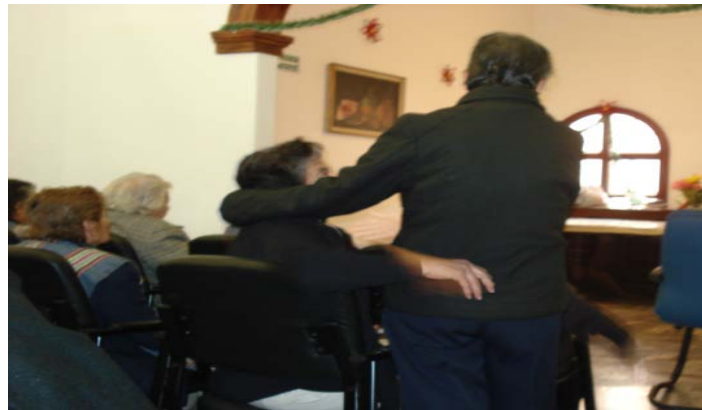
Contacto físico en los festejos y en la vida cotidiana