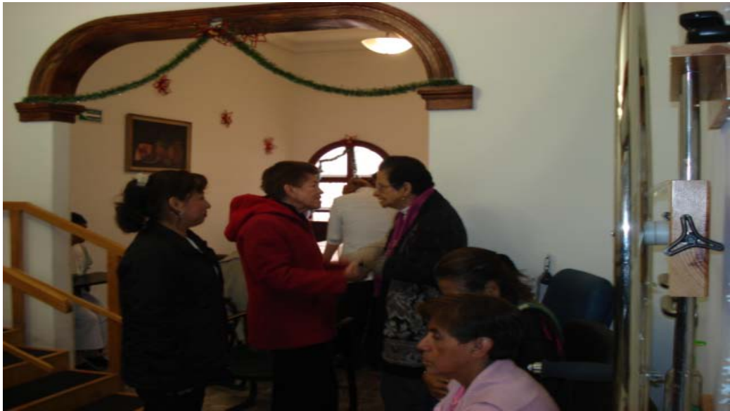
Integración grupal en el acondicionamiento físico. La anciana saludaba a todos sus compañeros