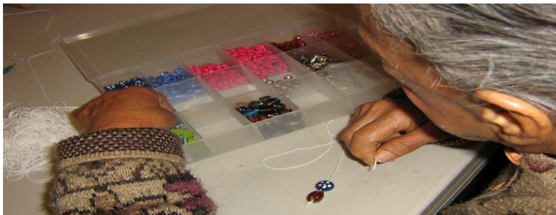
Terapias ocupacionales en Alzheimer México I. A. P. (San Antonio).