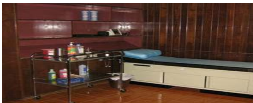
Consultorio médico en Alzheimer México I. A.P. (Polanco).

Dichas instituciones escolares ya conocían el trabajo que desempeñaban los patronos, la dirección, la trabajadora social y la enfermera desde Fundación Alzheimer I. A. P., “y cuando [los profesores] fueron a ese centro de día, las personas que dejaron en su lugar no estaban suficientemente capacitadas ni tenían experiencia, entonces no se sintieron igualmente acogidos, bajó mucho la calidad del aprendizaje del alumno; como no vieron viable, aunque fuera un centro aparentemente bien constituido”, se dirigieron a Alzheimer México I. A. P. Hasta ahora las lecciones continúan, por ejemplo, en el momento de mi observación, me tocó ver a tres estudiantes de psicología que fueron a aplicar pruebas cognitivas a los pacientes en un día. También me presenté dos días de un mes (noviembre) en que un profesor, una enfermera practicante y seis estudiantes de la licenciatura en enfermería de la FES Iztacala (UNAM), estuvieron en las distintas áreas del centro.