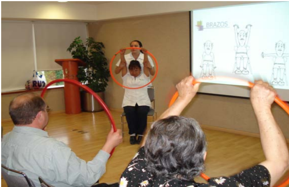
Rehabilitadora física enseñando algunas técnicas para ejercitar los brazos durante el grupo de apoyo

dolorosa su vivencia. El siguiente apartado tratará de profundizar más sobre la importancia del grupo de apoyo en Alzheimer México.