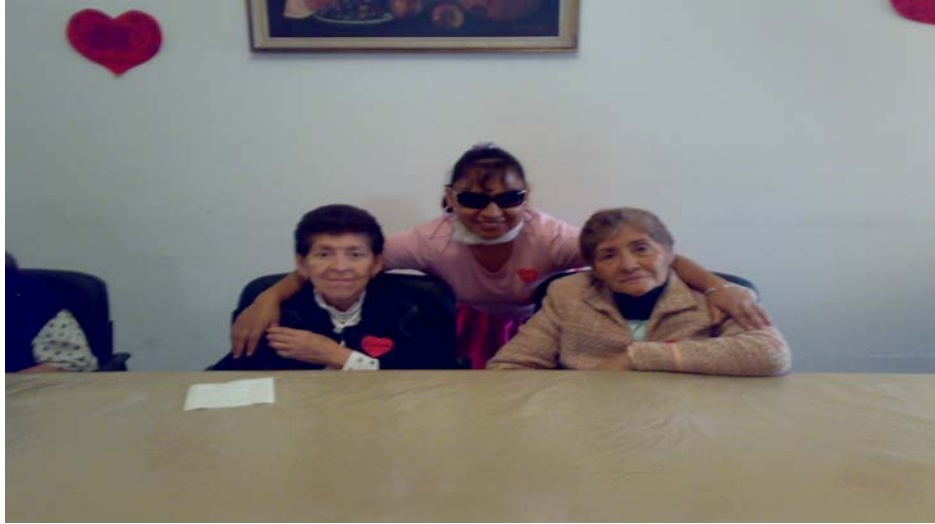
Gericultista en un festejo con dos pacientes