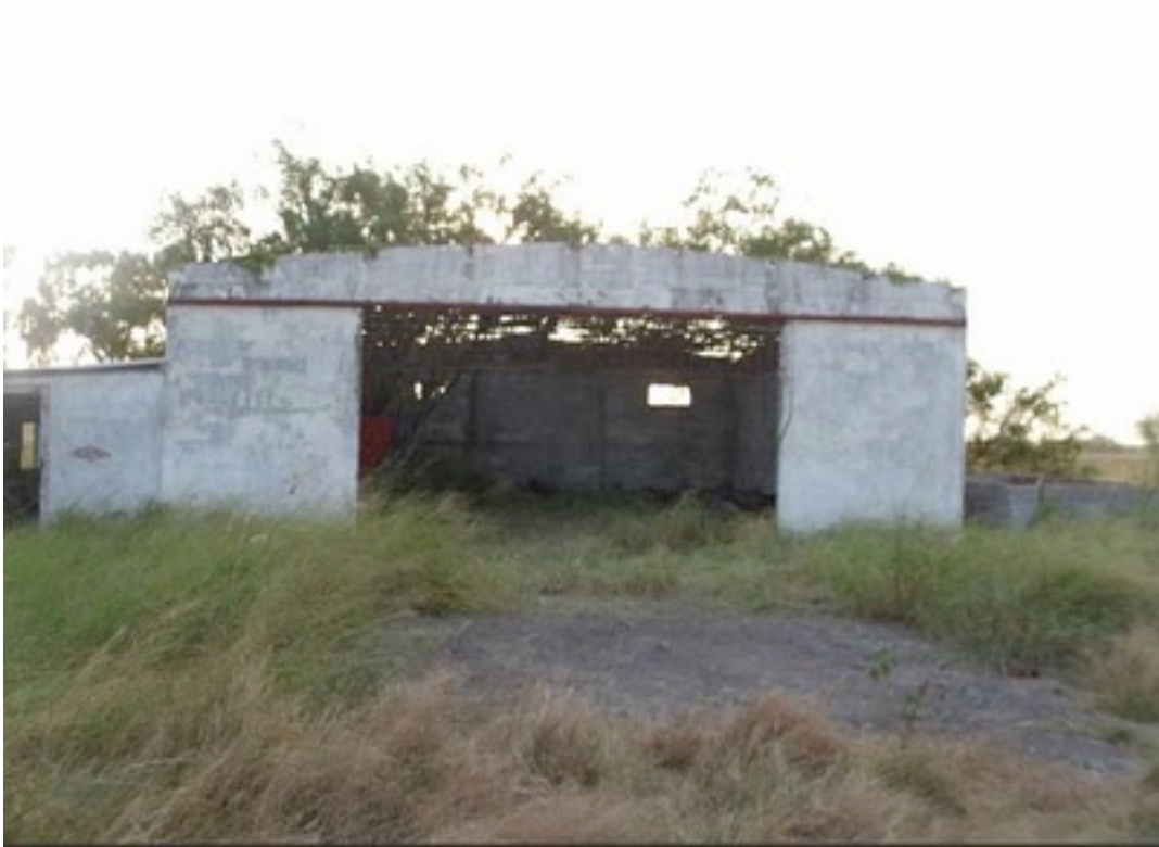
Vista frontal de la bodega donde se encontraron los cuerpos de los 72 migrantes 4

responde a un evento histórico particular, esta crisis es producto del uso de la frontera como un método 3 , un método estatal y la demanda de mano de obra, de trabajo.