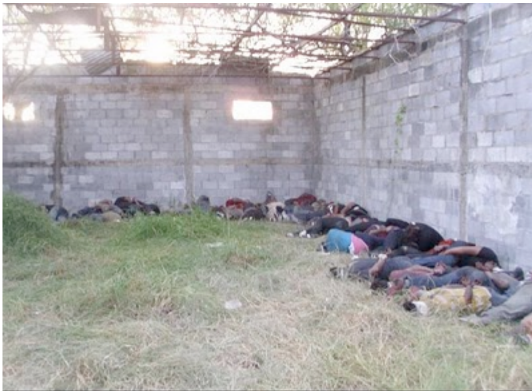
Forma en la que se dispuso de los cuerpos de los 72 migrantes. 5

La materialidad de la fosa es el único vestigio físico que queda de la muerte de los migrantes para denunciar y para dar cuenta de los procesos de muerte y del síntoma de su existencia como vidas desechables en este momento histórico. Estudiar esta materialidad presenta el imperativo de hacer una arqueología de dicha violencia, una arqueología que permita descubrir esta otra historia, esos muchos otros acontecimientos, pequeños y estrepitosos, fruto de la intersección de múltiples imposibilidades, siendo la más brutal la imposibilidad de vivir una vida humana .