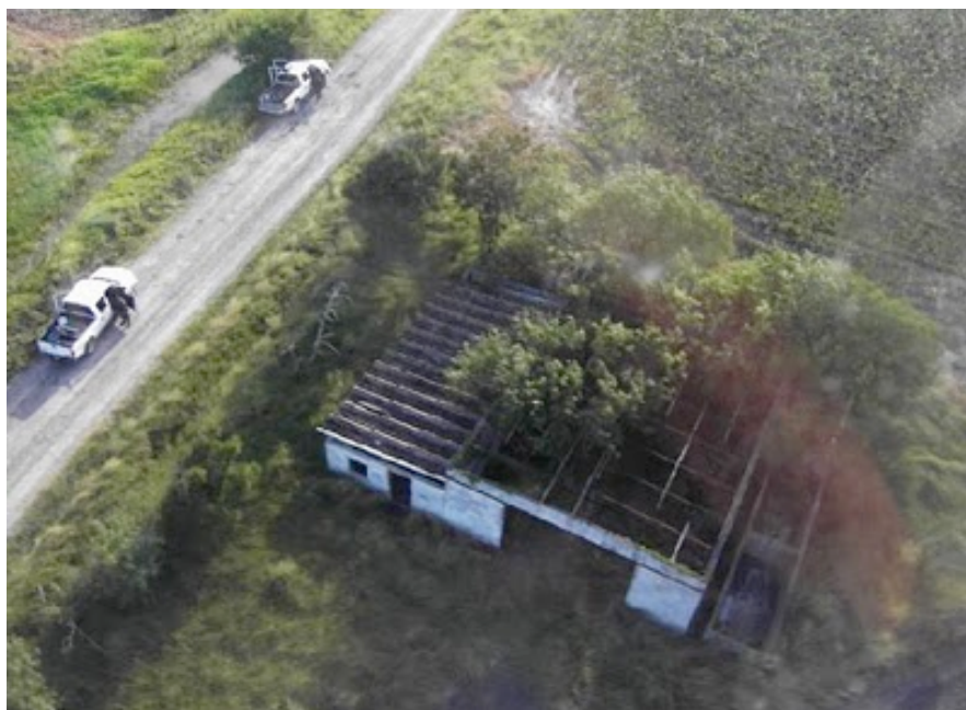
La bodega donde se encontraron los cuerpos de los 72 migrantes. 2

fosas, bodegas y campos es donde se colocan los cuerpos que nunca se pensaron necesarios, donde se destinan los excedentes. El migrante puede morir, y la muerte sin sepultura quizá sea la posibilidad más potente; puede que nunca se encuentren los cuerpos o que nunca se reconozcan, pero allá en los hogares de las madres, padres, hermanos, hijos e hijas, esposas y esposos, siempre estará presente una ausencia.