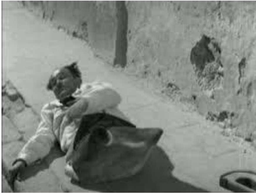
Fotograma de "Los olvidados" de Luis Buñuel