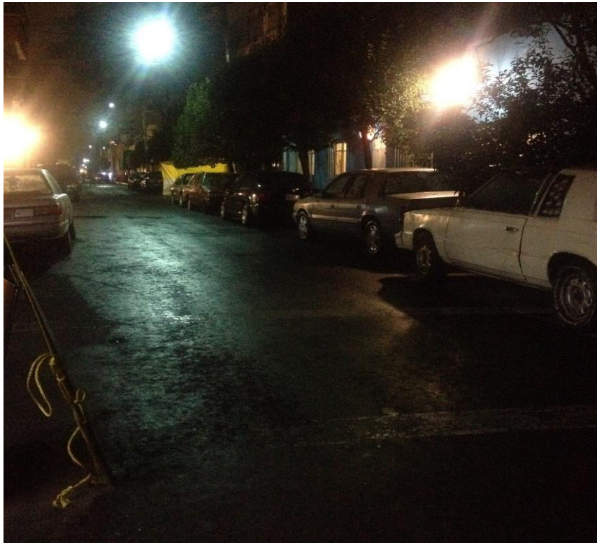
Fotografía tomada el 10 de octubre del 2014 en la Col. Valle Gómez