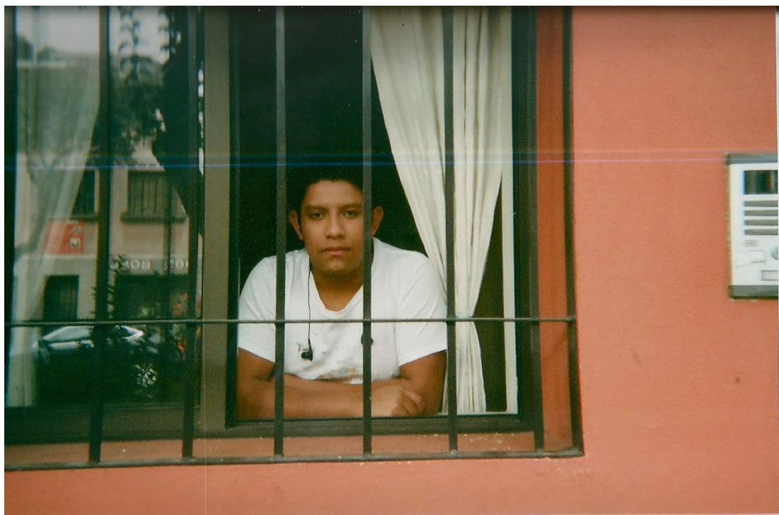
6.- Título: "Detenido en el presente". Medium shot, oscuridad en el interior, luz en el exterior. Enmarca el rostro detrás de unos barrotes. Autor: Ismael.