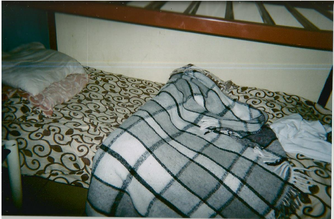
3.- Sin título. Toma picada de su cama deshecha e iluminada. Sensación de estar habitada. Cuerpo ausente. Autor: Santiago.