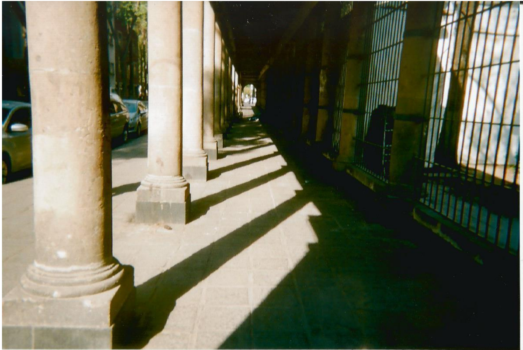
15.- Título: “La luz”. Toma abierta de un corredor con pilares, de lado izquierdo e iluminadas, y rejas del lado derecho en la oscuridad. Al fondo se percibe, como en punto de fuga, una puerta iluminada y a las faldas de ésta la silueta de alguien en el piso (persona en situación de calle).