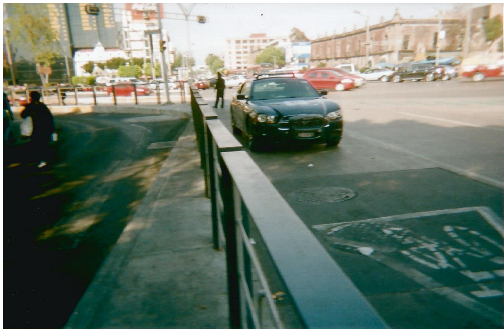
20.- Título: “Corrupción” Toma abierta de una patrulla estacionada sobre la calle, estática, “mirando” de frente.