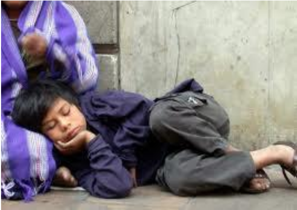
Fotografía de la revista "Diario de León" del 2012