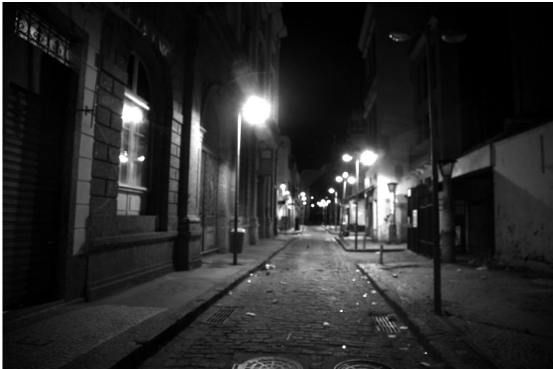
Fotograma de la película brasileña “El transeúnte” de Erik Rocha del 2010