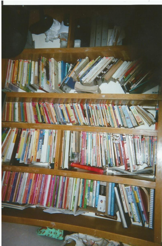
7.- Título: "Buch". Toma abierta que muestra libros apilados y amontonados. Autor: Carlos.