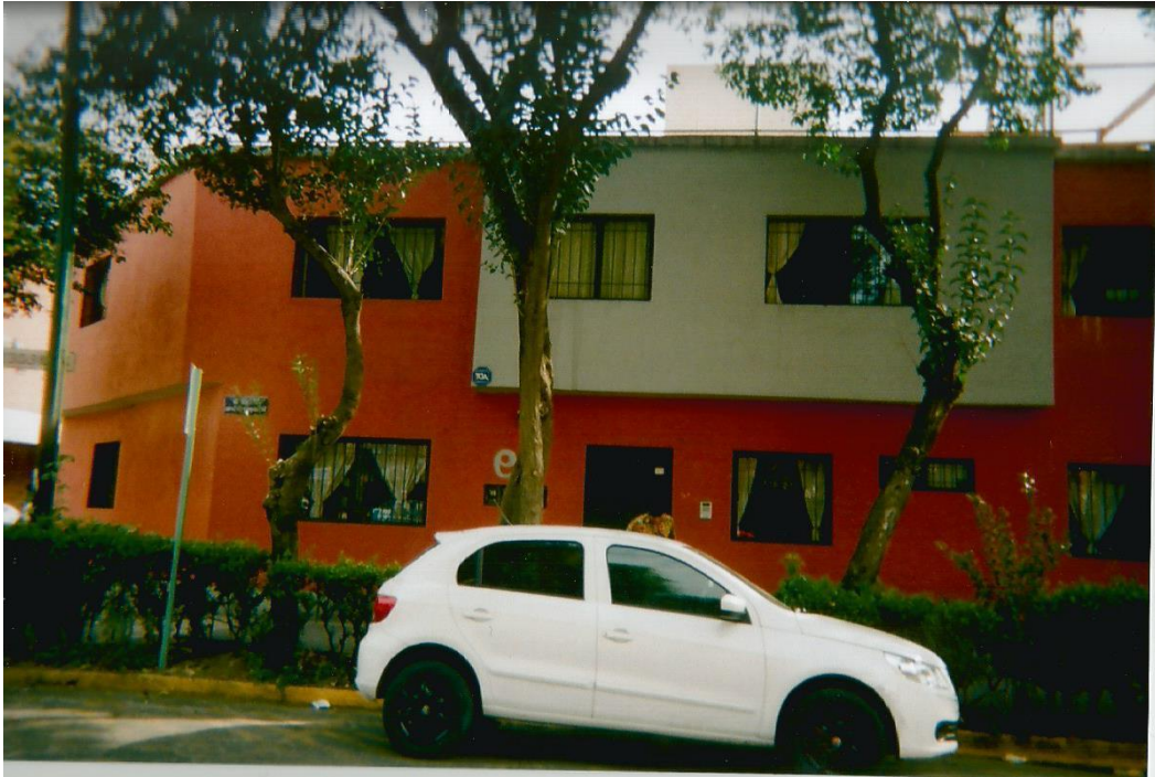
11.- Sin título. Toma abierta de la casa de transición vista desde la calle de enfrente en contrapicada. Abarca el cuadro de la fotografía. Autor: Javier.