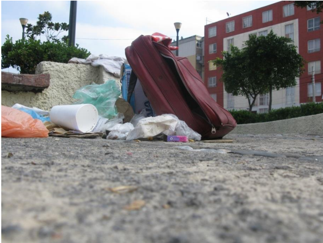
Fotografía tomada en el mercado “Lagunilla” el 26 de octubre del 2014