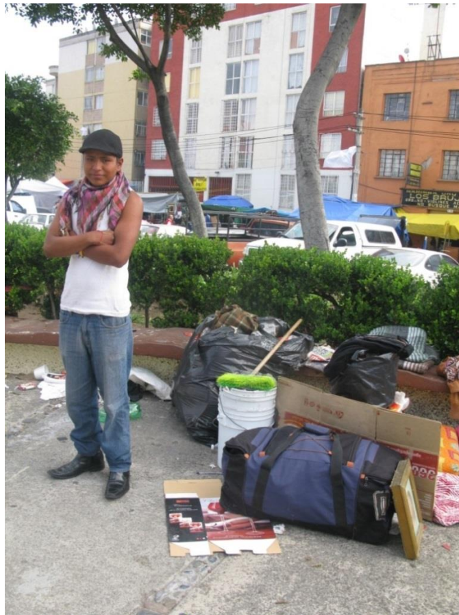
Fotografía tomada a un chavo de calle en el mercado “Lagunilla” el 26 de octubre del 2014