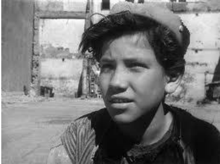
Fotograma de “Los olvidados” de Luis Buñuel