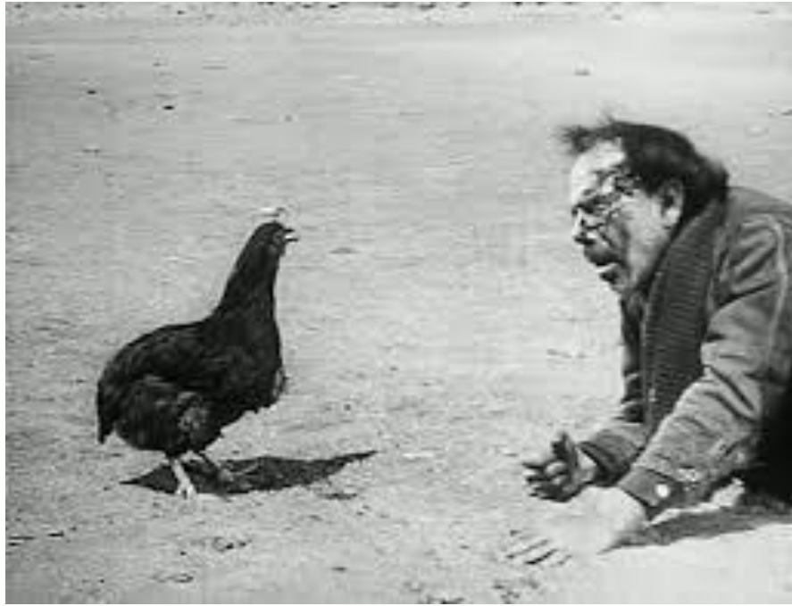
Fotograma de “Los olvidados” de Luis Buñuel