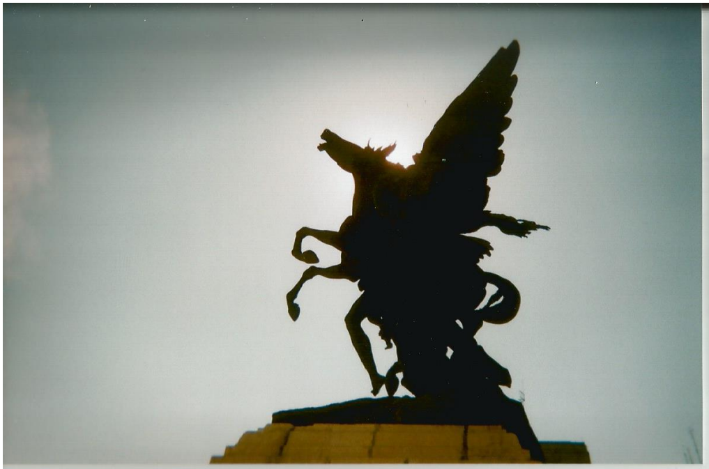
16.- Sin título. Contrapicada a contraluz de un monumento de un “caballo con alas”. El caballo con las en la mitología griega era conocido como Pegaso. Autor: Javier.