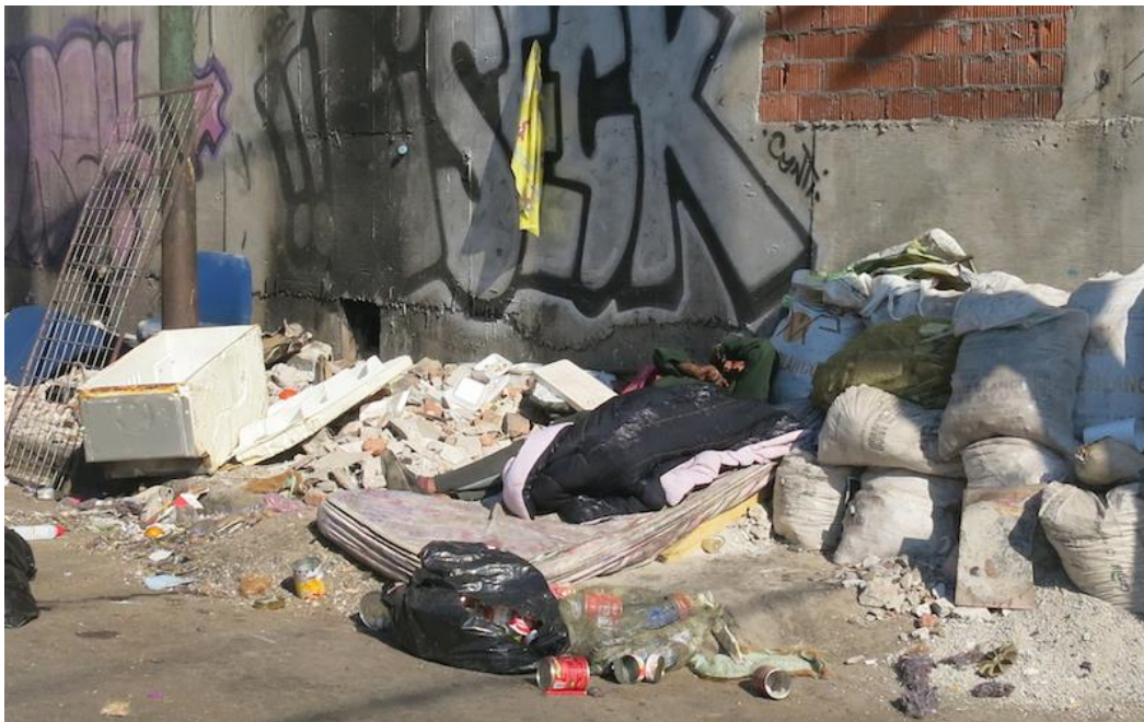
Fotografía del periódico Milenio haciendo referencia a “las calles” de Tepito