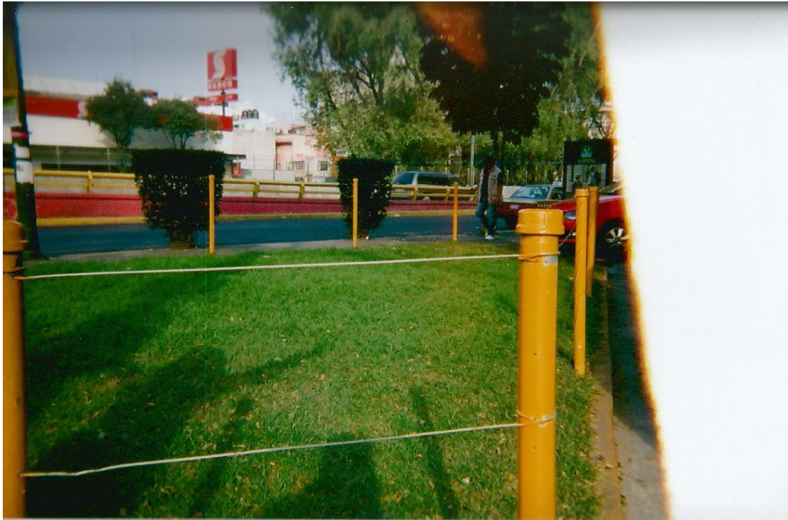
21.- Título: “Restringido”. Toma abierta de un jardín. Se ‘percibe la sombra de Ismael. Él se encuentra detrás de las líneas que restringen el jardín. Autor: Ismael