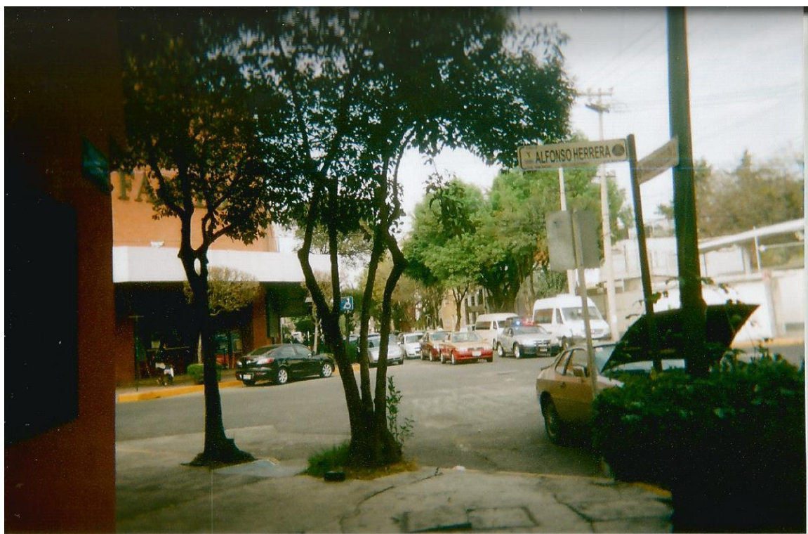
23.- Sin título. Toma abierta desde la puerta de la CTVI. Se percibe en un primer plano un automóvil con el cofre abierto. Calle iluminada. Autor: Santiago

En las fotografías de calle existen tres tipos de cuerpo que son el punto focal: los objetos como autos, monumentos, rejas o barrotes; las personas en situación de calle y el cuerpo ausente. En ninguna de las fotografías los jóvenes salen a cuadro, pero en algunos casos, se puede percibir la silueta de su sombra (fotografías 17 y 21).