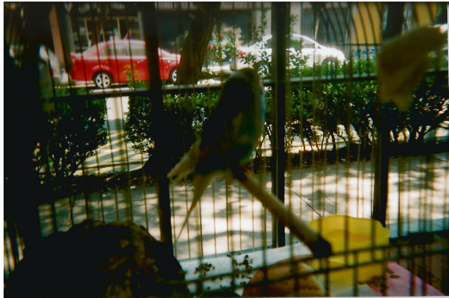
1.- Título: "Sin libertad". Toma en perspectiva de un ave enjaulada cuya jaula se encuentra detrás de los barrotes de la ventana. Contraluz. El ave mira hacia el exterior. Autor: Lalo