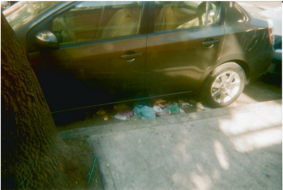
14.-Título: “Hay basura donde quiera”. Toma en picada semi abierta de basura debajo de un automovil negro. Autor: Lalo