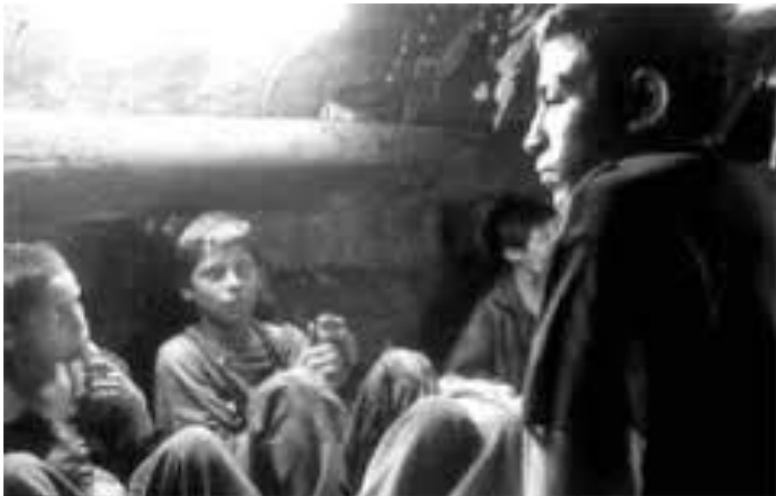
Fotogramas de la película mexicana "De la calle" del 2001