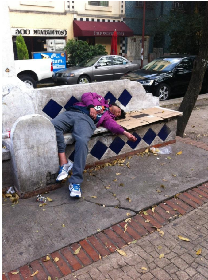
Fotografía tomada a un chavo de calle en la colonia Condesa el 9 de noviembre del 2014