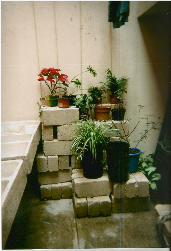
9.- Título: "Envidia". Toma abierta e iluminada de plantas, en el patio interior de la casa. Autor: Ismael.