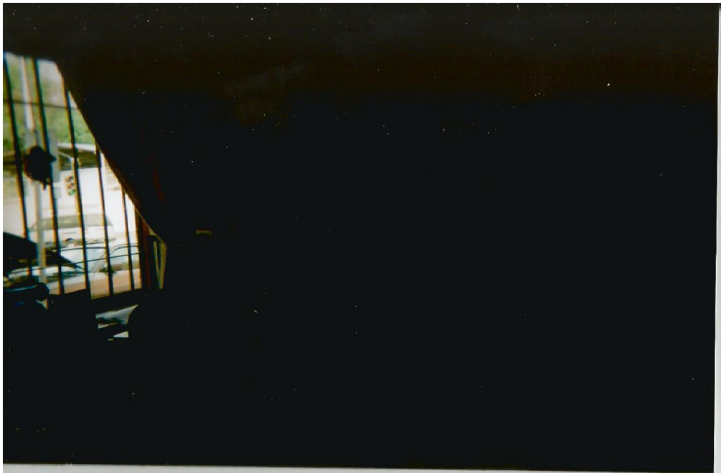
4.-Sin título. Toma en perspectiva de una ventana a contraluz. Enfoque en los barrotes. Interior oscuro, exterior iluminado. Autor: Javier.