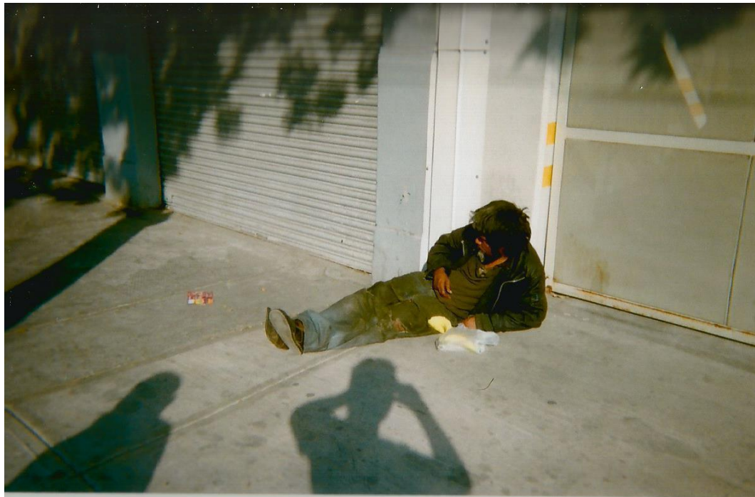
17.- Toma en picada de una persona en situación de calle. Se percibe la sombra de Javier (torso, brazos y cabeza) así como la sombra de un árbol y de otra persona que se encontraba a su lado.