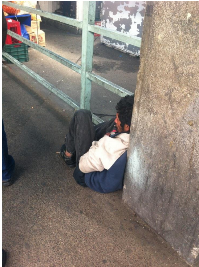
Fotografía tomada a un chavo de calle en el metro Tacubaya el 10 de noviembre del 2014