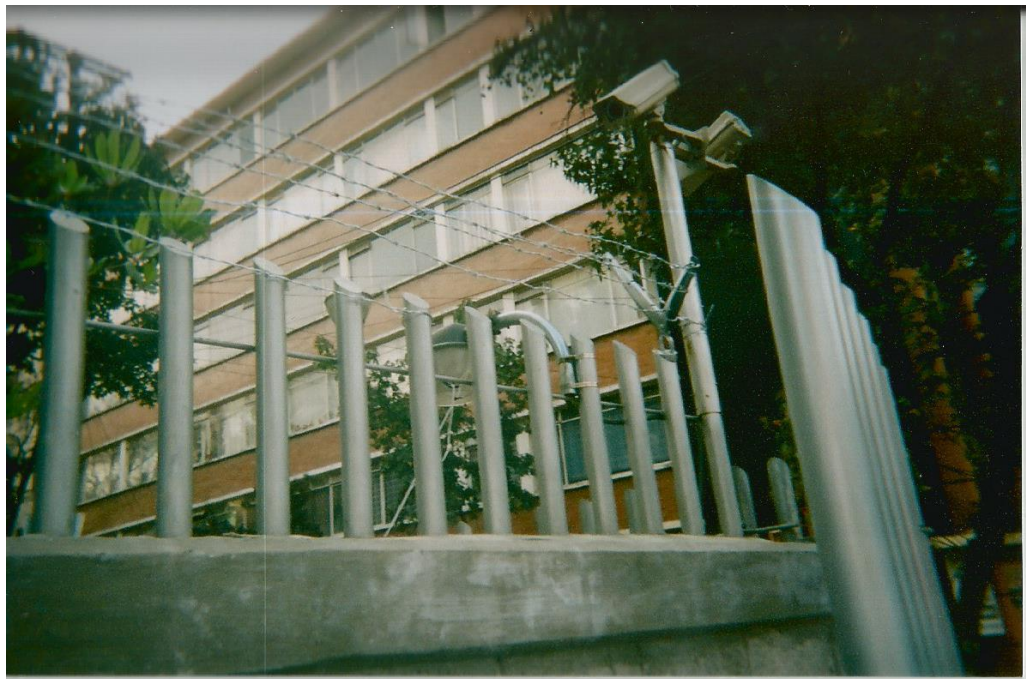
18.-Título: "Vigilado" Toma contrapicada de unos barrotes con cámara de vigilancia. A las espaldas se percibe un edificio. Toma iluminada. Autor Ismael.