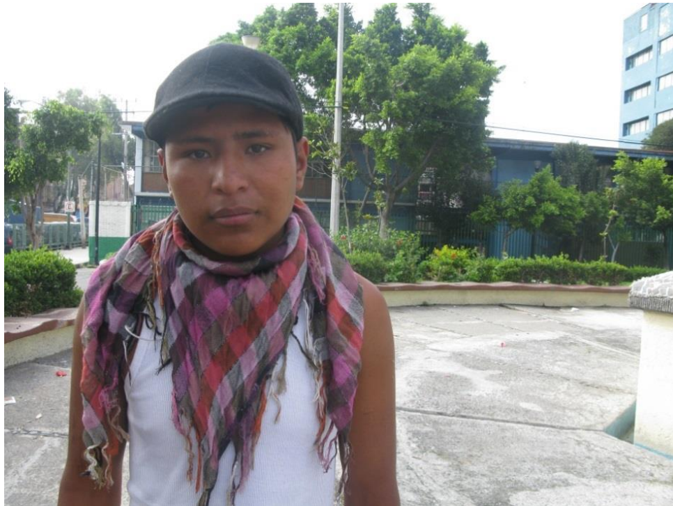
Fotografía tomada a un chavo de calle en el mercado “Lagunilla” el 26 de octubre del 2014