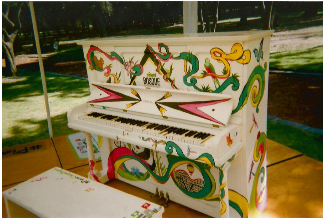
22.- Título “La calle suena” Toma en semi-picada de un piano en medio de un jardín. Autor: Lalo