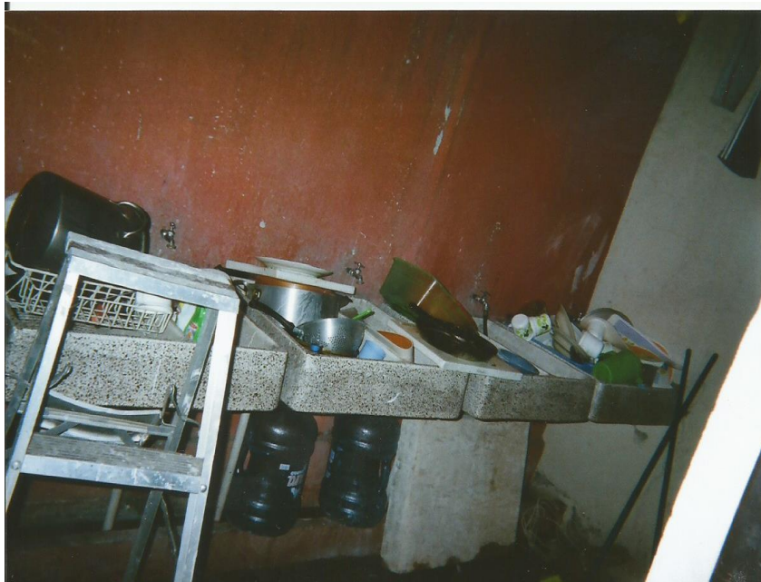
8.-Título: "Caos dos". Toma abierta de los lavaderos que se encuentran en el patio trasero de la casa. Trastes amontonados y demás objetos apilados. Autor: Carlos.