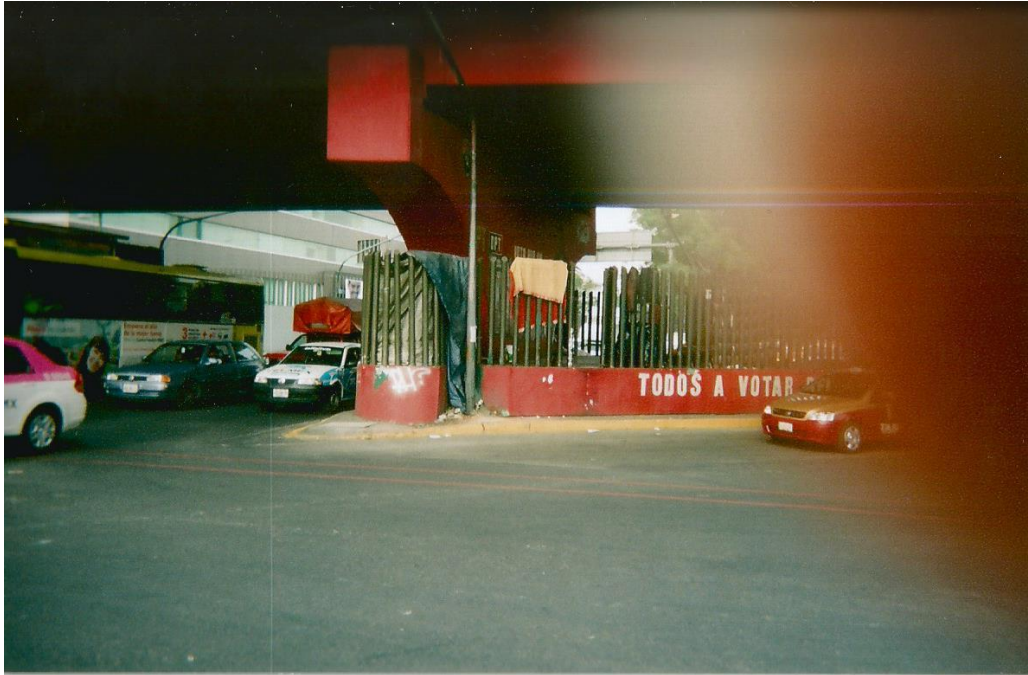
19.- Título: “Vida en calle”. Toma distante de una persona en situación de calle que vive bajo un puente. La persona se encuentra dentro de los barrotes a la cual no se percibe en la fotografía. Lo que se observa son mantas atravesadas sobre los barrotes. Autor: Ismael