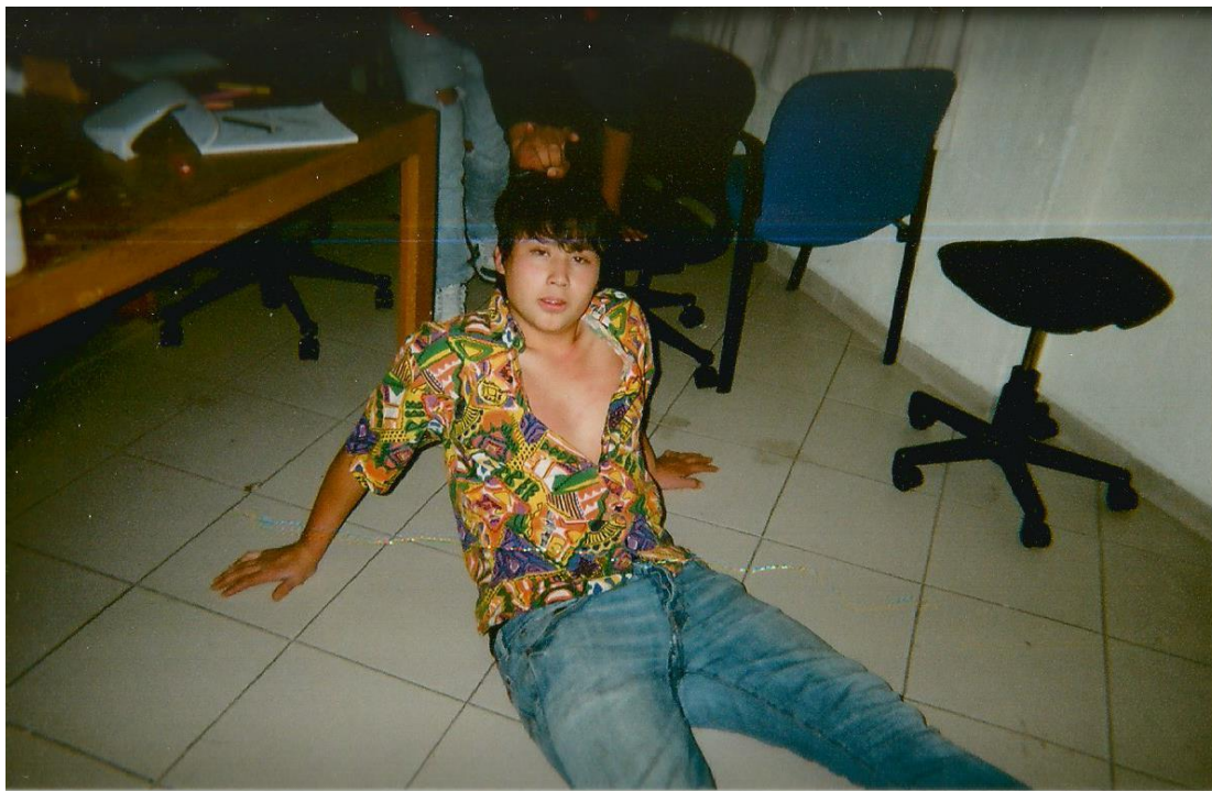
5.- Sin título. Toma picada e iluminada de un cuerpo en el piso con las manos, piernas y camisa abiertas. Autor: Federico.