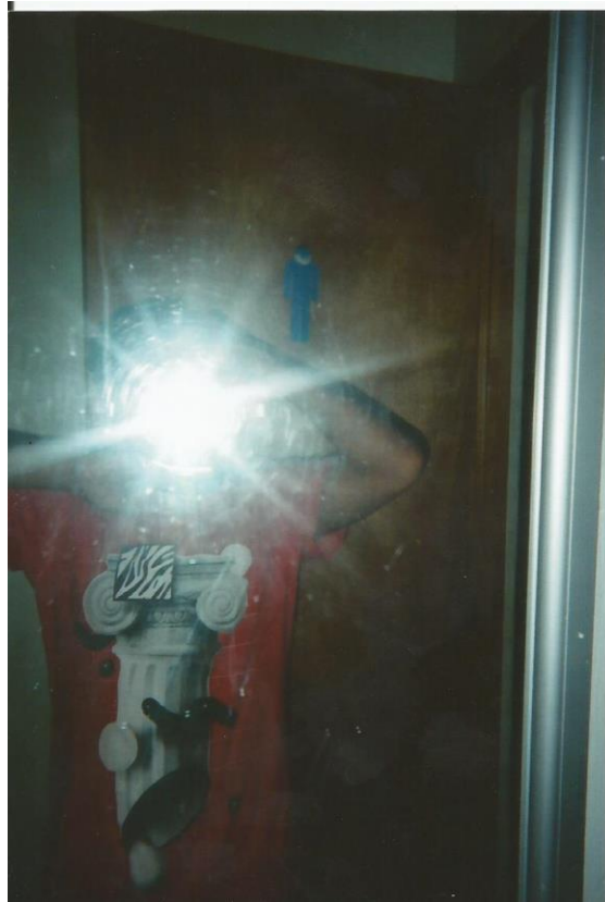
10.- Título: "Mirror" Medium shot de autorretrato en el espejo. Coloca la cámara a la altura del rostro por lo que sólo se percibe un halo de luz en contraposición con el resto de la foto que se ve oscura.