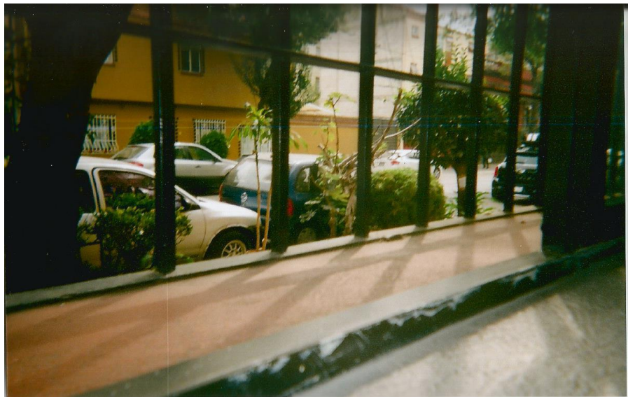
2.- Título: "Detenido en el tiempo". Toma cerrada en perspectiva. Contraste de iluminación: oscuridad dentro-luz exterior. Autor: Ismael.