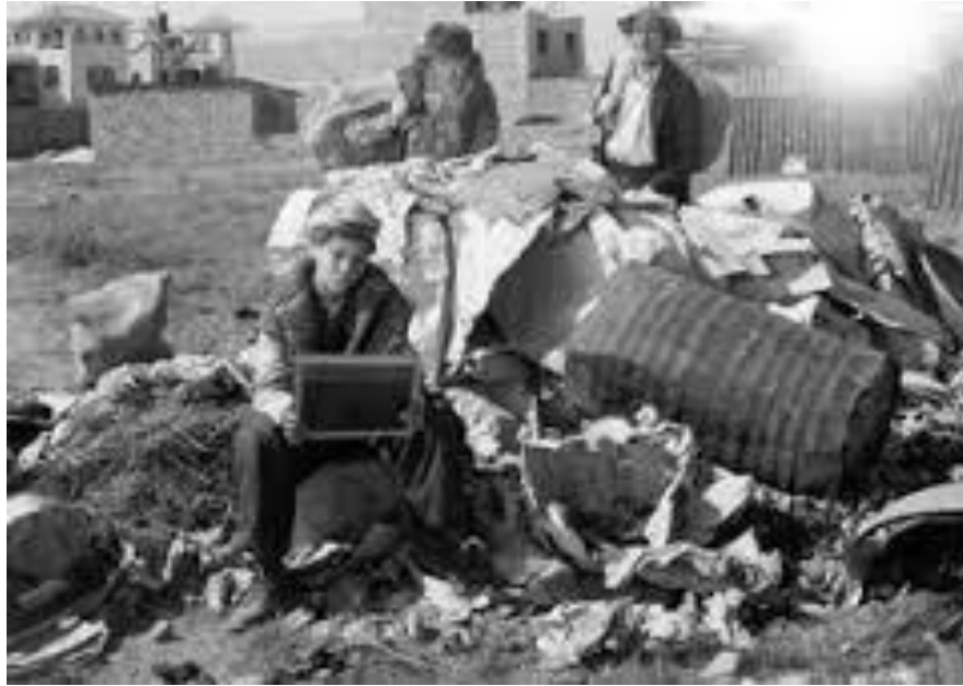
Fotograma película “Los olvidados”