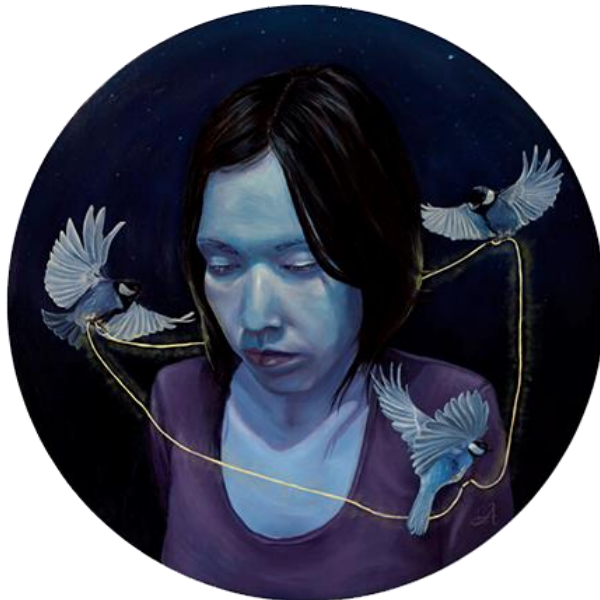
Fig. 9 Laura Vega, La visión , 2016.