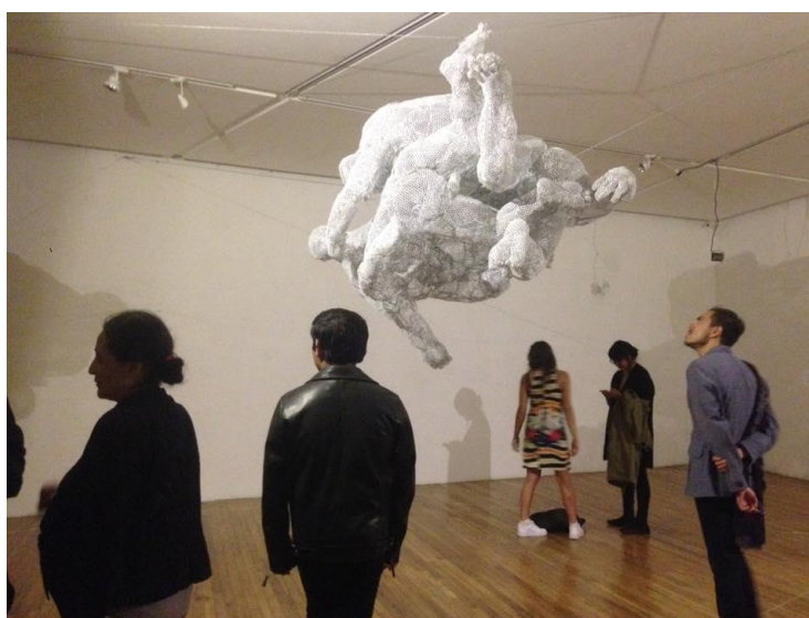
Fig. 17 Instalación “.0”, durante la inauguración de Girl Power , 2017, Galería Libertad, Querétaro.

La experiencia que surgió del trabajo en conjunto con Minor (Fig.18) en la selección y montaje de las piezas fue enriquecedora en varios sentidos. Se apreció un rompimiento de la brecha generacional que puede existir entre artistas jóvenes y experimentados cuando nos sentábamos en el suelo a descansar en grupo, o pasábamos más de doce horas continuas en un trabajo intenso de montaje, todos a la par colaborando. Fue también en la selección de artistas para la muestra colectiva, que se pensó en abrir espacios para artistas no sólo jóvenes y emergentes, sino con una carrera artística ya sólida y con experiencia.