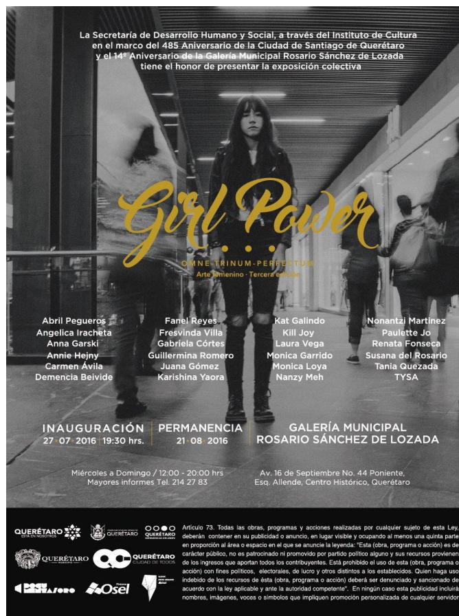
Fig. 5 Cartel de la tercera edición de Girl Power , 2016.

Había tres asuntos importantes que había que tratar desde el proyecto, para que éste no fuera solo una exhibición más: las exposiciones de mujeres, la representación del retrato femenino en la pintura y el género, que durante la reunión con las artistas se concluyó que este último no era un elemento a considerar en la producción artística, pues tanto la producción de las mujeres como la de los hombres se tenía que valorar según su calidad plástica y no por el género del artista. La mayoría de nosotros no rebasaba los 28 años, y eso fue lo que me llevó a querer saber qué pasaba con las artistas de otras generaciones y a realizar entrevistas para explorar con más detenimiento, en qué estado se encontraban las cosas con respecto a las mujeres artistas en la ciudad de Querétaro y si la iniciativa de Girl Power estaba aportando algo además de las dudas.