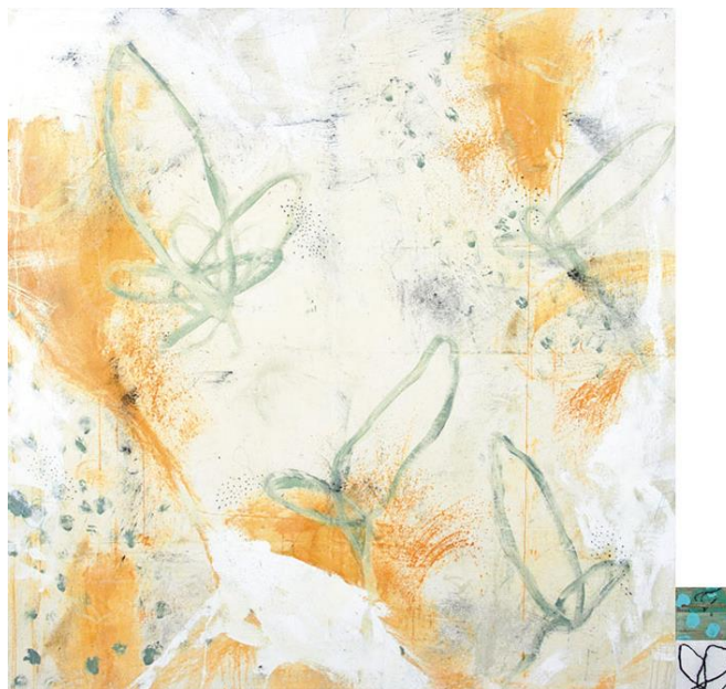
Fig. 12 Esmeralda Torres, Serie Retoños , 2012, mixta sobre tela. (Imagen tomada de Esmeralda Torres, www.esmeraldatorres.com )