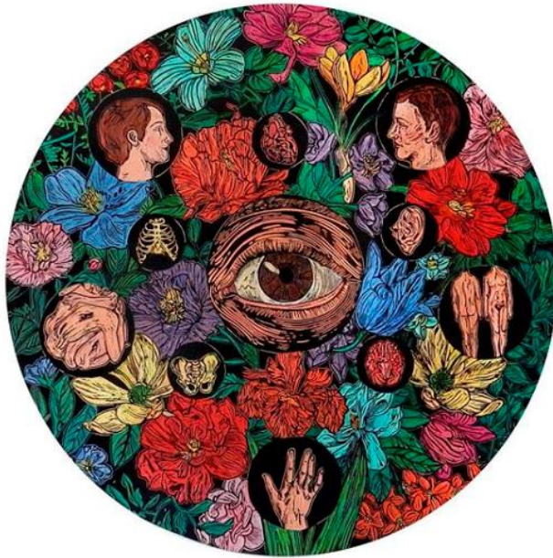
Fig. 15 Brenda Castillo, Sin título, 2016, tallado y acrílico sobre MDF.