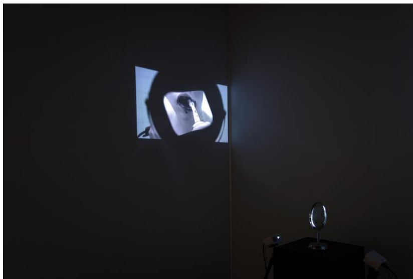
Fig. 3 Anna Garski, Endless Scopophobia I , video-instalación con espejo y mini proyectores, 4:33 min, 5:38 min, 2015. (Tomada de Anna Garski, www.annagarski.com )

Además de las artistas que participaban en la exposición, se invitó a cuatro a colaborar en la elaboración de un mural durante los días anteriores y posteriores a la exposición, dos de ellas, Kill Joy y Tysa (1988?), paralelamente también brindaron talleres gratuitos de gráfica y graffiti en el Centro de Arte Bernardo Quintana y en la colonia Hércules respectivamente (Fig.4). En estos talleres, la mayoría de las participantes eran mujeres jóvenes estudiantes, o interesadas en las técnicas artísticas. Se realizó un ciclo documental sobre mujeres directoras en colaboración con la organización DocumentaQro 8 , los cuales se proyectaron en el Cineteatro Rosalío Solano y a la par de todo esto, se organizó, a petición de las autoridades municipales, una exposición fotográfica, colectiva en La Alameda con la temática “Ser Mujer en Querétaro”(Fig.5).