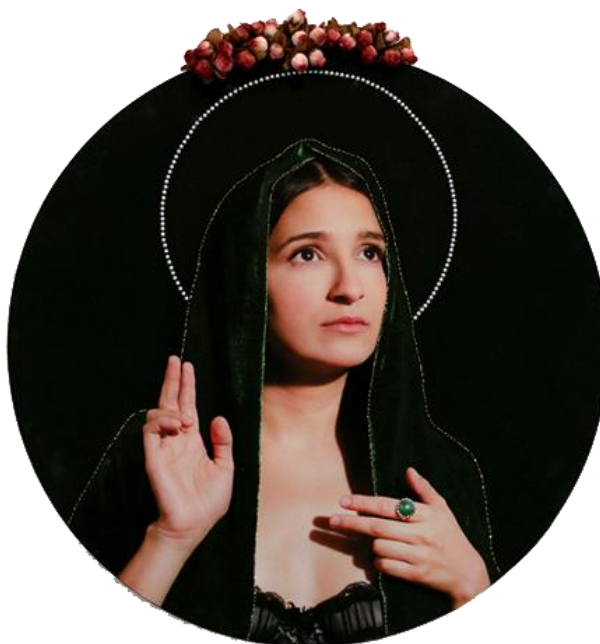
Fig. 10 Mónica Garrido, Sin Título , 2016 Fotografía con aplicaciones de bordado y mixtas.