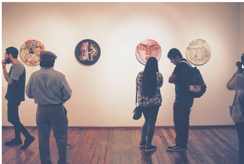
Fig. 6 Inauguración de la tercera edición de Girl Power , 2016, Galería Municipal, Querétaro.