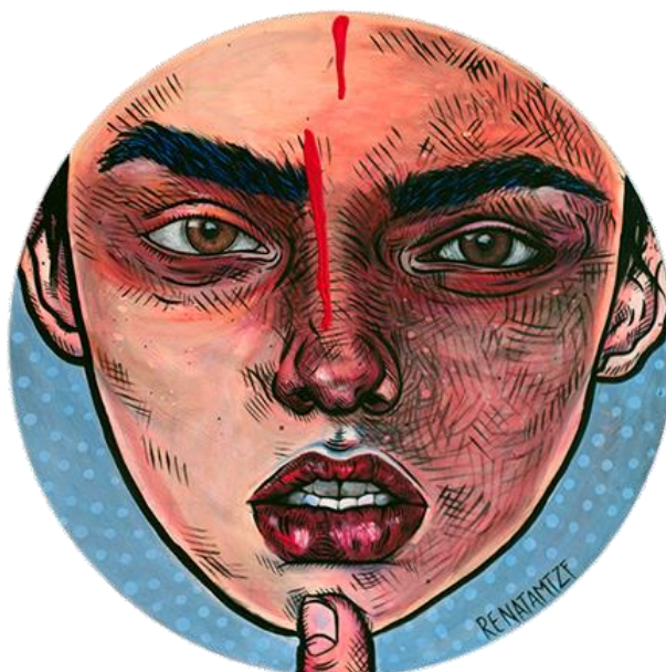
Fig. 11 Renata Fonseca, Sin Título , 2016, acrílico sobre MDF.