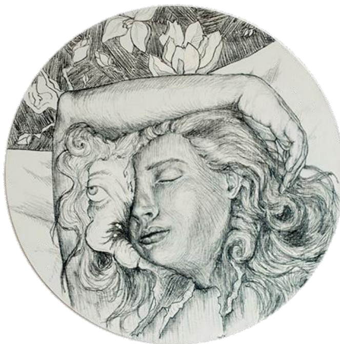
Fig. 7 Nanzy Meh, L'inconnue dormante , 2016, grafito sobre mdf.