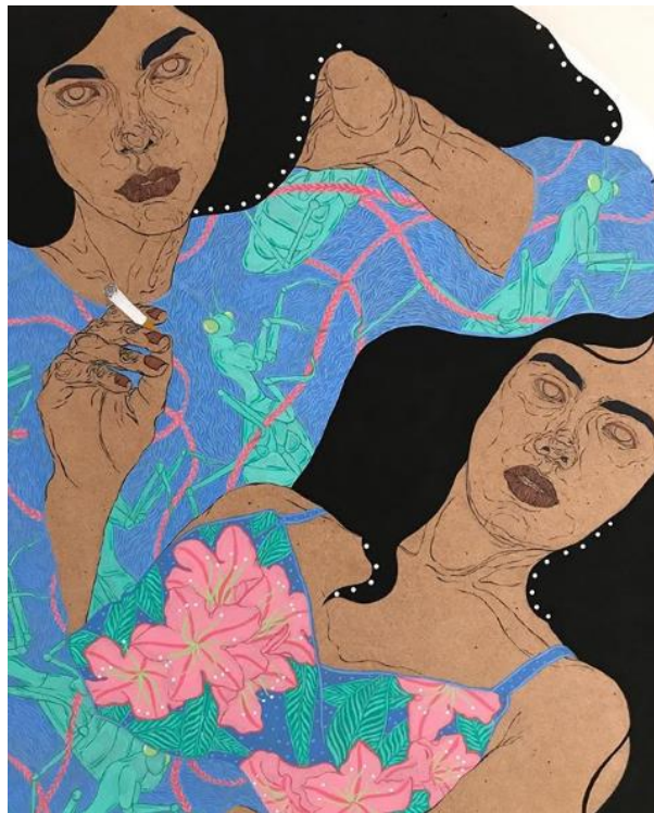
Fig. 16 Kaethe Butcher, Beware Goddesses , 2016, mixta sobre MDF.