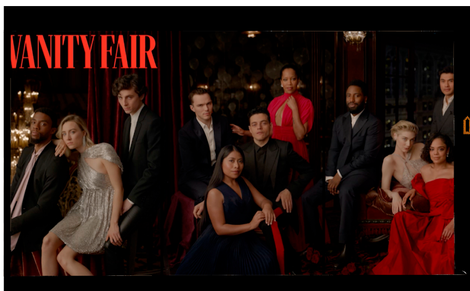
Imagen 1.8 Portada de Yalitza en Vanity Fair . 87