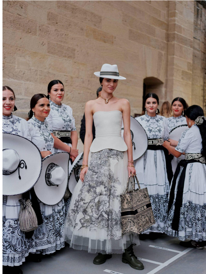
Imagen 3.6 Fotografía publicitaria del desfile Cruise 2019 de Dior. 316

Igualmente, en la imagen 3.6, se observa un complemento relevante, el sombrero. Para esta ocasión Maria Grazia Chiuri eligió el famoso sombrerero Stephen Jones, quien hizo una afirmación reveladora en uno de los videos publicados en la cuenta oficial de Dior en YouTube como parte de la campaña Cruise 2019 . De ese comentario, lo que interesa señalar es una frase que parecería en primera instancia, inocente, no obstante, denota parte de la inspiración de la directora creativa de Dior para la colección del vestido que se le puso a Yalitza en el editorial de Vogue : “este fue el primer prototipo que hice para Maria Grazia. Le gustó la forma, pero la paja era demasiado áspera, y ella quería algo que recordara más a la Avenue Montaigne y menos a la plaza del Zócalo de la Ciudad de México”. 317 De lo anterior, se puede analizar cómo las metrópolis siguen considerando a la periferia como un desfase que necesita ser absorbido y resituado dentro de sus espacios