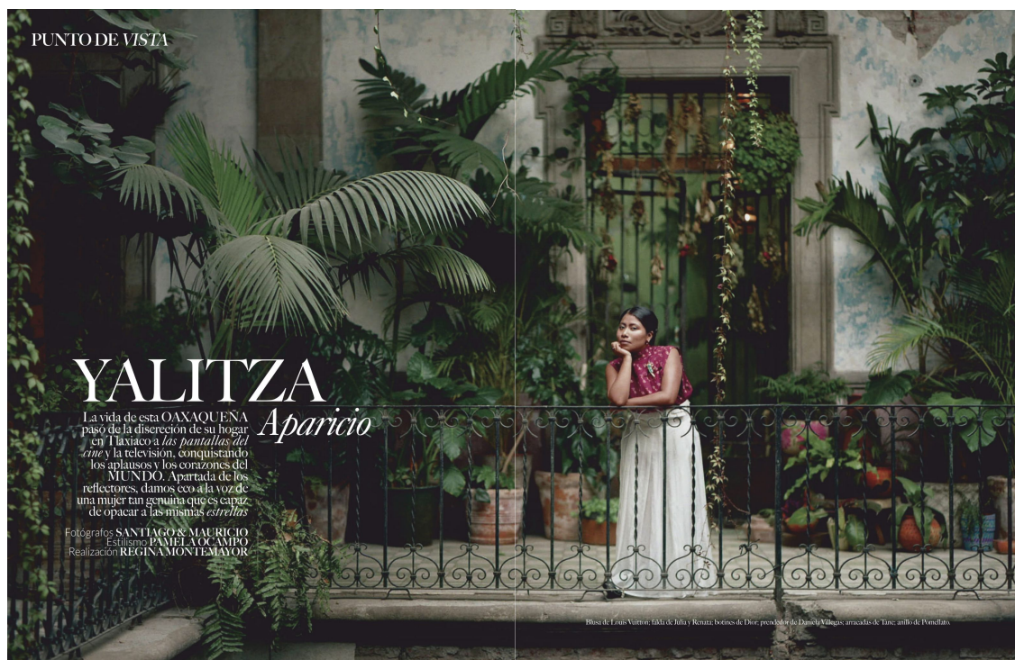
Imagen 2.4 Fotografía uno del editorial de Yalitza en Vogue México. 187

Esto abre una serie de consideraciones alrededor de la presencia de Yalitza Aparicio en Vogue , justamente por todas las ficciones que se ponen en juego a la hora de tensionar las representaciones (estereotipos) históricamente naturalizadas en torno a las identidades indígenas mexicanas. Lo que queda claro es que en la fantasía creada por Vogue México y Latinoamérica , se produjo una hibridación insólita que recogió ciertas singularidades de “lo indígena” y lo hizo parecer chic , fashion y fancy , 186 calificativos que en la historia se erigieron como opuestos al imaginario que gira en torno a las ficciones de “lo local”.