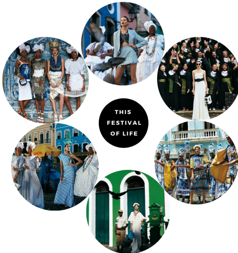
Imagen 2.1 Editorial de Vogue Japan 2013: “This festival of life” 174

La imagen 2.1 corresponde a una producción editorial publicada en Vogue Japan en 2013 y estuvo orquestada por un equipo de italianos; el fotógrafo de la sesión fue Giampaolo Sgura, la editora de moda, Anna dello Russo y, la dirección del casting estuvo a cargo de Piergiorgio Del Moro. Todos estos profesionales partieron del concepto de la latinidad 175 para construir la narrativa visual, lo importante de este ejemplo, es que hace evidente la permanencia de la “colonialidad del ver”, 176 los remanentes y la permutación de la