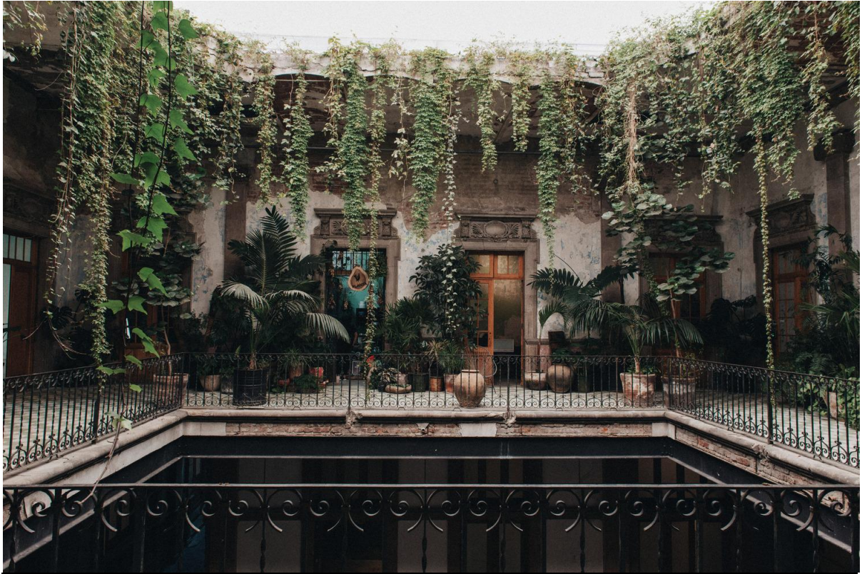
Imagen 2.5 Fotografía de la locación del editorial de Yalitzá 199