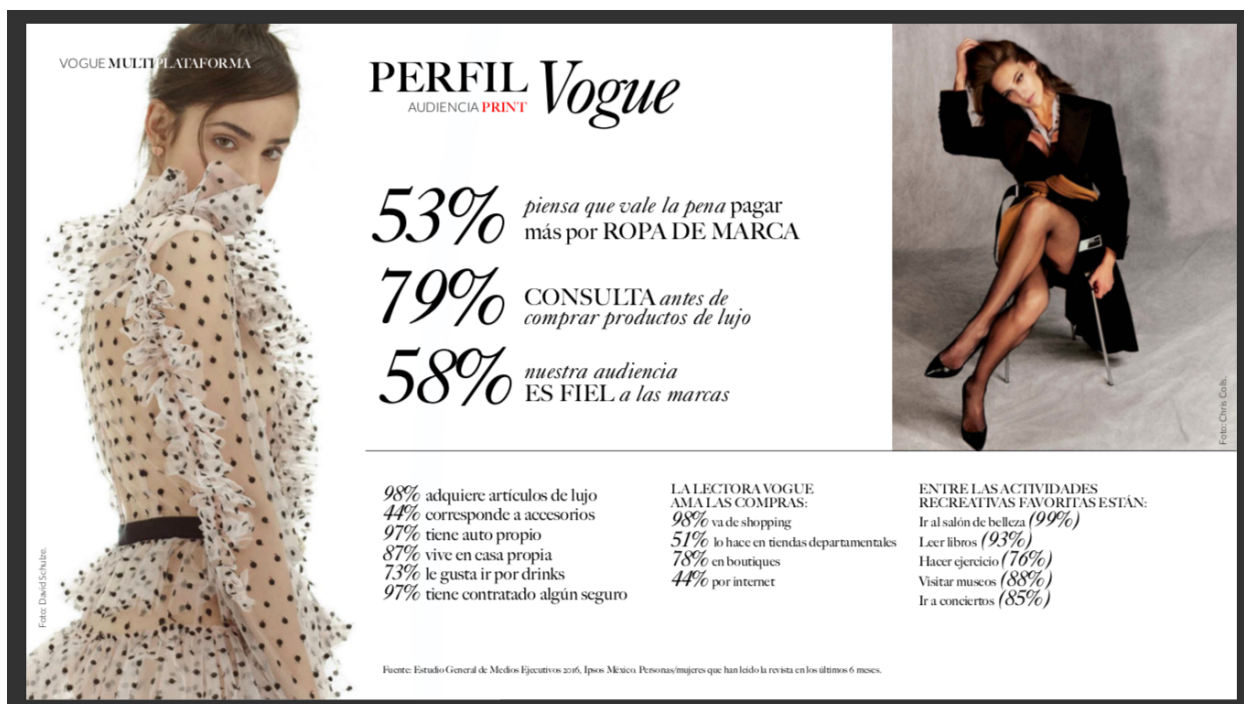
Figura 1.11 Informes de media kit de Vogue México y Latinoamérica en 2018 140

producto más de la técnica, de la ideología del poder”. 139 En la imagen siguiente se puede apreciar la construcción del target por la editorial.