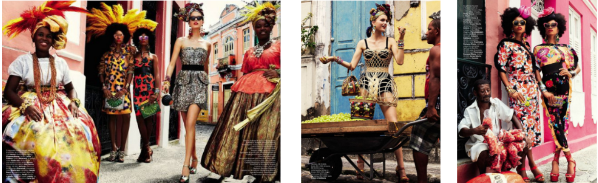
Imagen 2.2 Editorial de Vogue Brasil 2013: “Carmen Miranda reloaded” 179

La segunda producción que se analizará en este apartado, es el editorial de Vogue Brasil publicado en la edición de febrero del 2013 (la imagen 2.2). El equipo de estilismo que planeó la sesión fue el mismo que la imagen anterior. La lógica que siguió el trabajo partió de la comparación y la diferenciación entre locales y extranjeros, perpetuando siempre una disparidad de corporalidades: la superioridad de unos sobre otros. Las mujeres bahianas con cuerpos normativos fueron vistas como atractivas y ocupadas como estandarte de la inclusión por la revista, en cuanto a indumentaria, se les negó la individualidad en estilo y se homogeneizaron las prendas que usaron en comparación con el outfit de la modelo blanca. Por otro lado, en las fotografías hay mujeres con cuerpos no normativos y estas son, en gran medida, folklorizadas y sus imágenes terminaron siendo objetualizadas, pero, sobre todo, se ve una fuerte exotización que parte de las diferencias culturales.