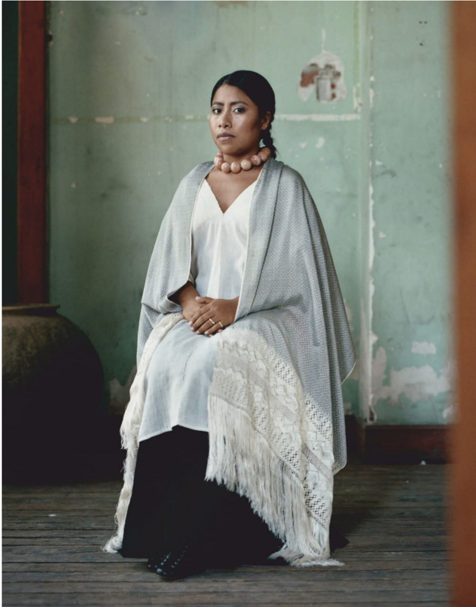
Huipil y falda de Remigio Mestas; rebozo clásico; collar de Serpentine; botas de By Far en The Feathered; anillos de Varon.