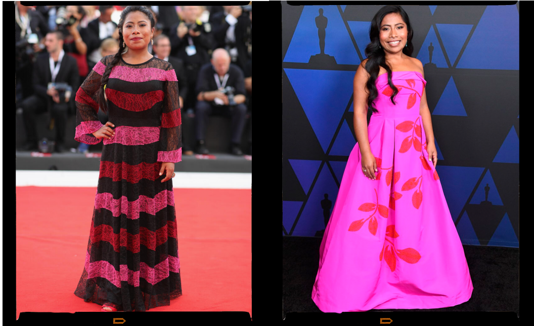
Imagen 1.2 A la izquierda Yalitza en el Festival de Cine de Venecia 2018 . 80 Imagen 1.3 A la derecha Yalitza en The Governor's Awards 2019 . 81