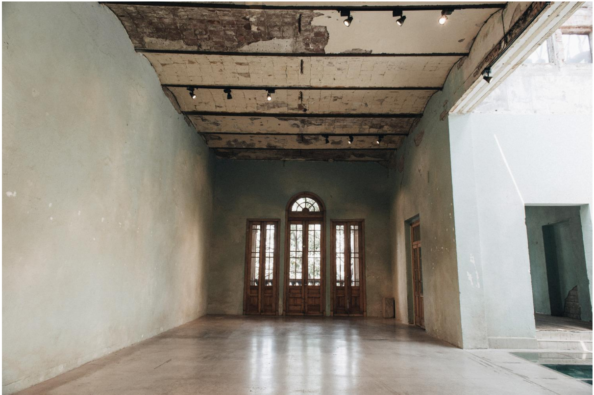
Imagen 2.6 Fotografía dos de la locación del editorial de Yalitza 200

En la fotografía 2.5 y en la 2.6 se presenta la elección del spot que hizo el equipo de estilismo de moda de Vogue . Se trata de un edificio que tiene una coordenada temporal específica en la historia del país. El diseño estuvo al mando del arquitecto Manuel Gorozpe después de haber sido encargado por el Dr. Ignacio Capetillo. Fue un edificio de departamentos ubicado hasta hoy en la calle General Prim 29, 32 y 34 de la colonia Juárez en la Ciudad de México. La fachada y los interiores del inmueble tienen una estética característica de la época del porfiriato, su construcción inició en 1900 y terminó en 1906. En 2013, la propiedad fue comprada para crear Proyecto Público Prim, y una de las decisiones que se tomó fue mantener el edificio en el estado de desgaste con que se adquirió, conservando así su lectura formal original. 201