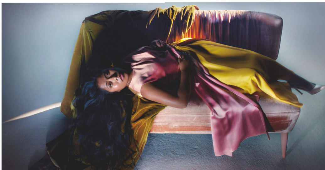
Yalitza Aparicio Roma