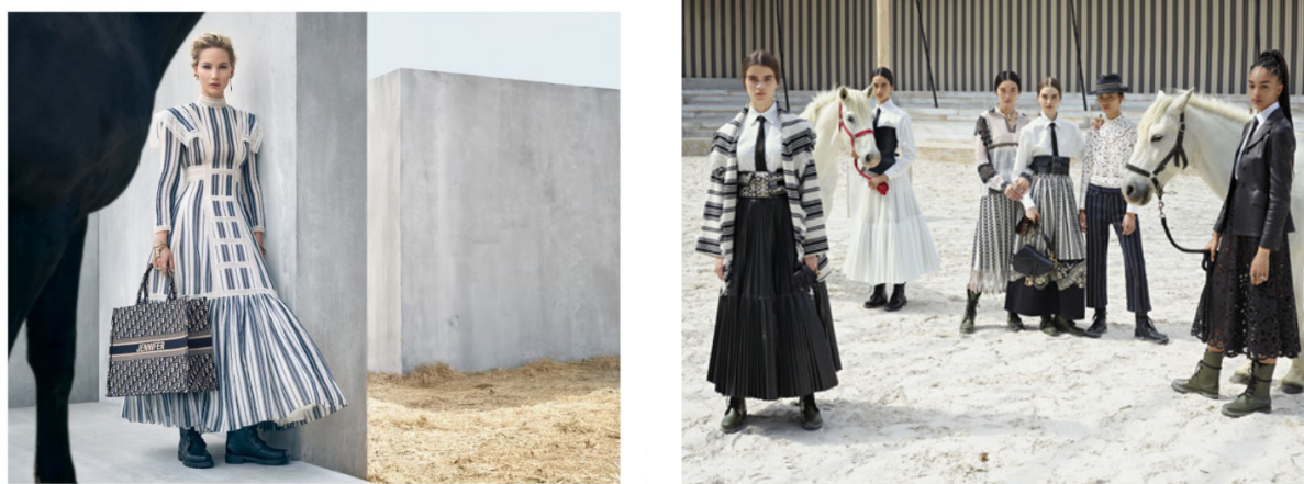
Imagen 3.5 Fotografías de la campaña publicitaria Dior, Cruise 2019 . 314

diseñar para vestir a mujeres con características físicas similares a las de Yalitza Aparicio. Y es importante mencionar que la charrería no es un deporte practicado por indígenas en México.