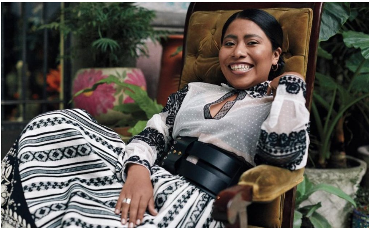
Imagen 3.4 Fotografía tres del editorial de Yalitza en Vogue México. 308

Ahora bien, en esta ocasión es necesario poner atención al vestido que el equipo de estilismo de moda eligió para estas tomas, ya que a diferencia de las dos fotografías que analicé en el capítulo dos (imagen 2.4 e imagen 2.7), en éstas (imagen 3.3 e imagen 3.4) el spot no tiene un protagonismo importante; es la indumentaria la que ocupa la mayor parte de la composición. Como ya lo dije, la blusa, el cinturón y la falda son de Dior de la colección cruise 2019. Lo interesante del vestido es el contexto que lo llena de sentido. Maria Grazia Chiuri es la actual directora creativa y diseñadora en jefe de la casa francesa Dior . Para esa colección, Chiuri se inspiró en las escaramuzas charras que son parte de la práctica femenil del deporte de la charrería en México, el cual consiste en la puesta en marcha de una coreografía a caballo con música de fondo. Lo que llamó la atención de la diseñadora italiana básicamente fue la forma en que estas mujeres se insertan, sin perder “su feminidad”, en un ámbito diseñado para hombres, así lo dijo ella. 307 En esta perspectiva de la diseñadora, habría que distinguir una mirada delimitada por estereotipos de género relacionados con la feminidad.