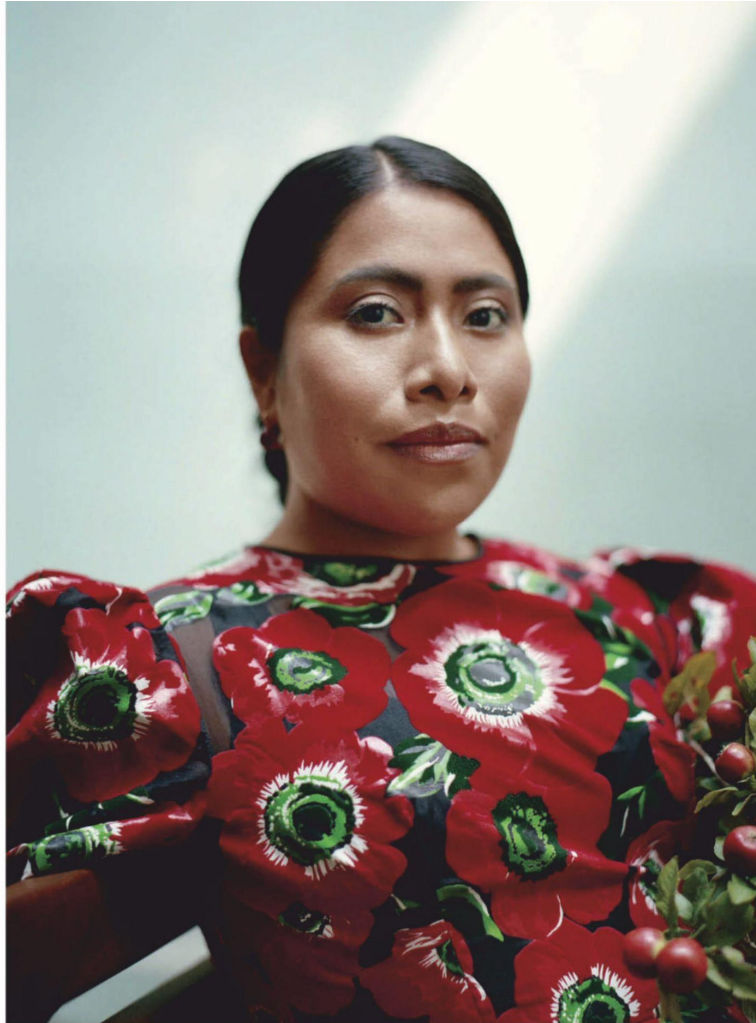
Vestido con estampado y aplicaciones, y mangas estilo globo, de Dolce & Gabbana; pendientes de Pomellato.