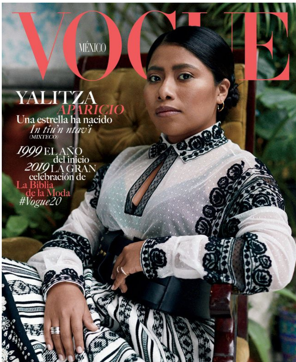
Imagen 3.3 Yalitza Aparicio en portada de Vogue México 306

La actriz, en ambas fotografías se encuentra sentada en una silla. En la portada se encuentra recta, con un brazo sostenido sobre la silla. Su expresión facial es seria en la portada, mientras que en la fotografía tres del editorial, Yalitza se encuentra sonriendo y con una pose menos erecta. Las imágenes tienen un foco selectivo que trepida el spot , es decir, que éste no se ve nítido, no obstante se pueden distinguir plantas tropicales y macetas decoradas con flores pintadas.