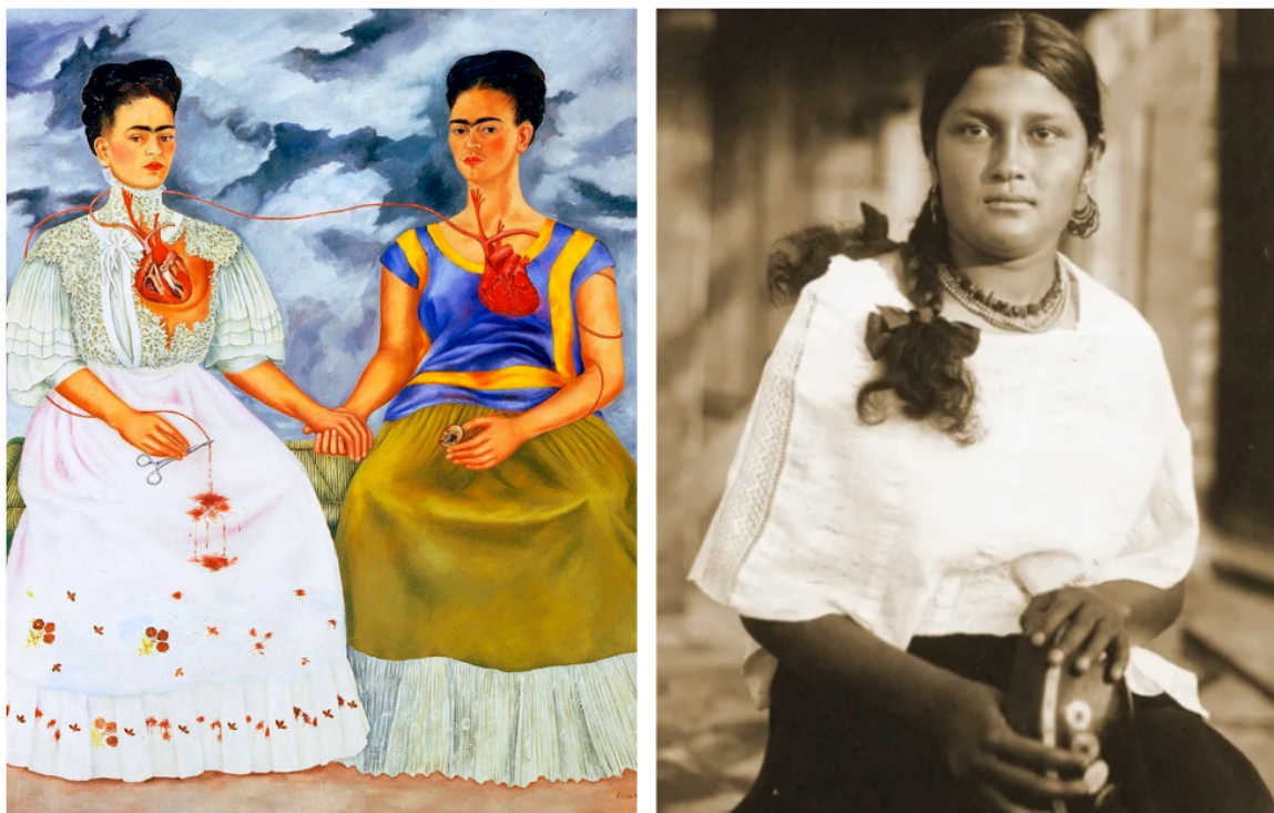
Imagen 2.8 a la izquierda pintura de Frida Kahlo, “las dos Fridas”, 247 a la derecha fotografía de la India Bonita. 248

cuerpos de las Fridas. No obstante, en la fotografía de Yalitzza es complejo leer la postura del cuerpo, se mira rígida.